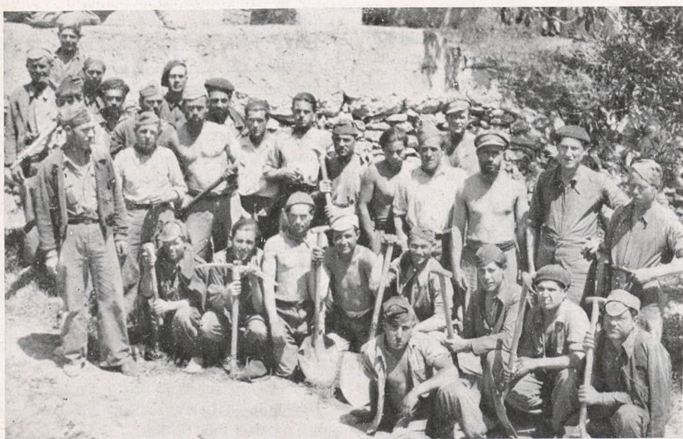
En el segundo Batallón se ha trabajado incesantemente para fortificar. En el grupo, muchos de los soldados que han colaborado en la transcendental labor.

1.ª Para mí representan los 13 puntos 13 firmes y sólidos puntales en los que se apoya fuertemente nuestra joven República Española, la que podrá realizar por fin, contando con esta consistente base, los anhelos más caros y sentidos de nuestro pueblo.