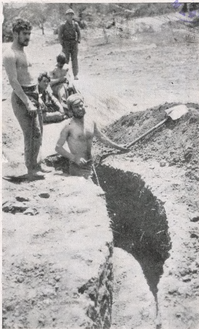
Los torsos desnudos, los brazos fuertes del combatiente van haciendo el dibujo profundo de las trincheras de Levante.

LAS SOLUCIONES TIENEN QUE PARTIR DE NUESTRO GOBIERNO. HAY QUE PRESTARLE TODO NUESTRO APOYO, YA QUE DISCUTIR PUBLICAMENTE SUS RESOLUCIONES ES CREAR OBSTACULOS :—: