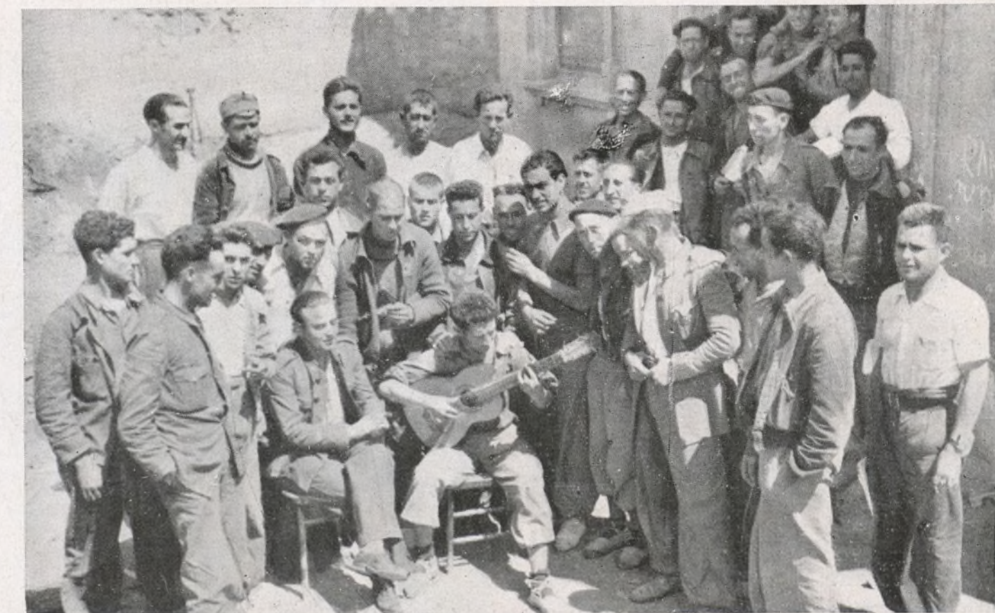
Los futuros oficiales después de dar la clase en la escuela de sargentos, se reúnen con la cordialidad característica en los luchadores del pueblo.

3.ª Es inmejorable. Expresa cuanto de noble tiene el pueblo español,