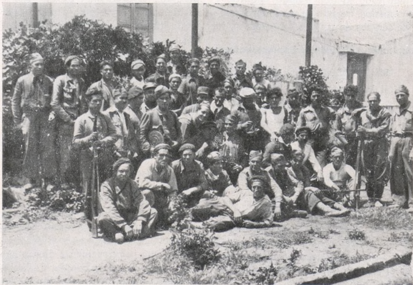
Los batallones de la Brigada en noble afán de competencia han fortificado inmejorablemente.

Fortificar, no lo olvidéis nunca, es una de las mejores condiciones que puede poseer un ejército para llegar a realizar la consigna lanzada por el Gobierno: "RESISTIR".