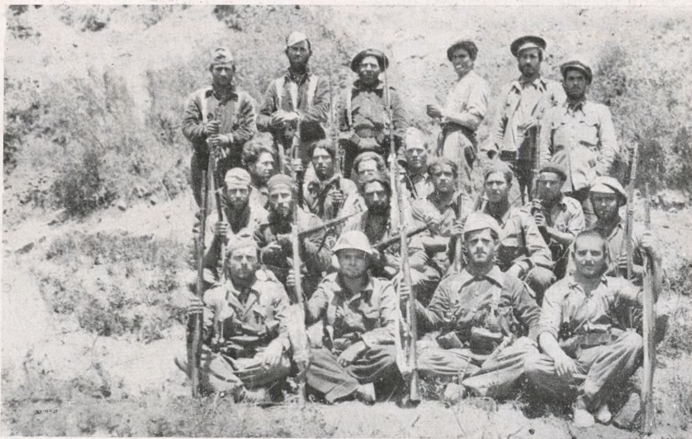
Compañeros del cuarto Batallón que se han distinguido por su entusiasmo en la construcción de refugios.

La República vencerá. Para ello hace falta que todos laboremos por la victoria. Unos en un sitio y los demás en otros. Lo inadmisibile es que todavía en uno u en otro sitio se le dé beligerancia a los que, siendo vagos, pretenden no serlo.