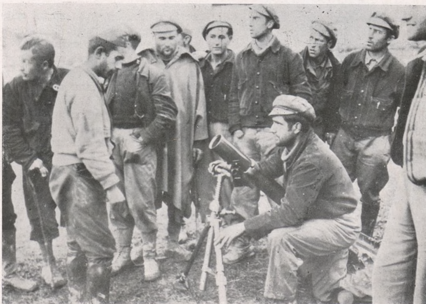
En el Ejército republicano, más potente cada día, se revisan las armas que conducen a la redención.