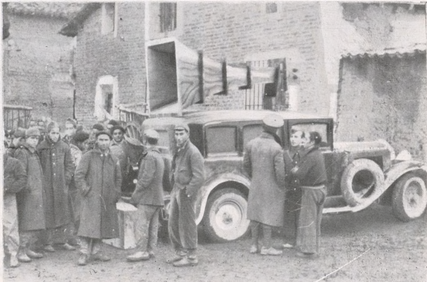
Después de haber pasado muchos días seguidos en las trincheras, algunos compañeros de la Brigada se encuentran en uno de los pueblos de la Alcarria descansando.