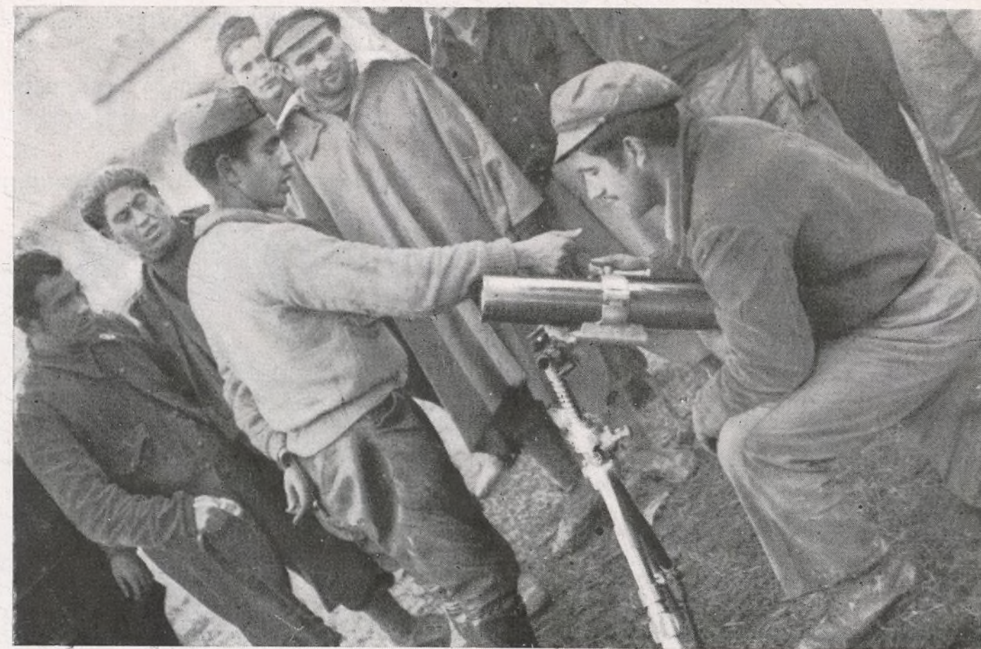
El luchador y su arma, los dos elementos que en la vanguardia salvan, jornada tras jornada, a la República.

Construido el esqueleto de la obra, se procede a su ocupación, distribuyéndose la fuerza en la forma que haya de guarnecerla y realizando sucesivamente por orden de urgencia los trabajos que requiera, teniendo para ello en cuenta lo que se expuso en "Fortificación".