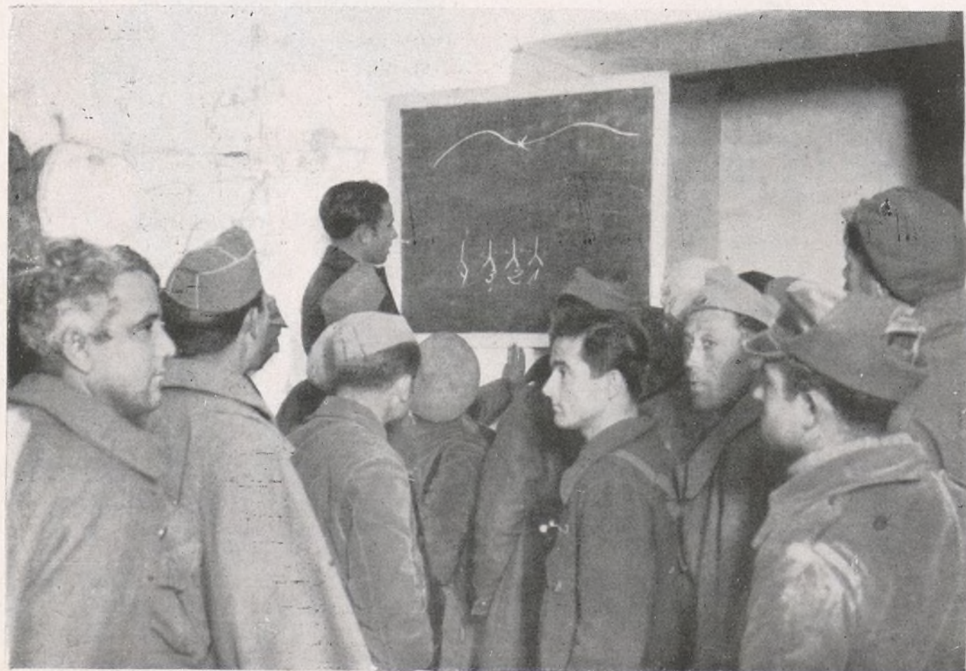
Más cultura y más seguridad en el triunfo, a medida que pasa más tiempo.

LA GUERRA UNE A LOS HOMBRES. LOS QUE PIENSAN DENTRO DE UNA ESFERA, ANTE EL HECHO INMENSO QUE HOY VIVIMOS, DEBEN DE SACRIFICAR SUS CONVICCIONES, PARA SUSTITUIRLAS POR LA "OBSESION" DE LOGRAR LA VICTORIA :— :— :— :— :— :—