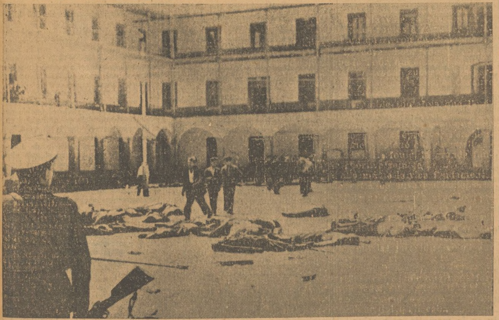
He aquí el cuartel de la Montaña, convertida en fortaleza por los sublevados y que el pueblo de Madrid asalto y rindio con las únicas armas de su valor y su fe. En el grabado aparece el patio del cuartel después de la rendición