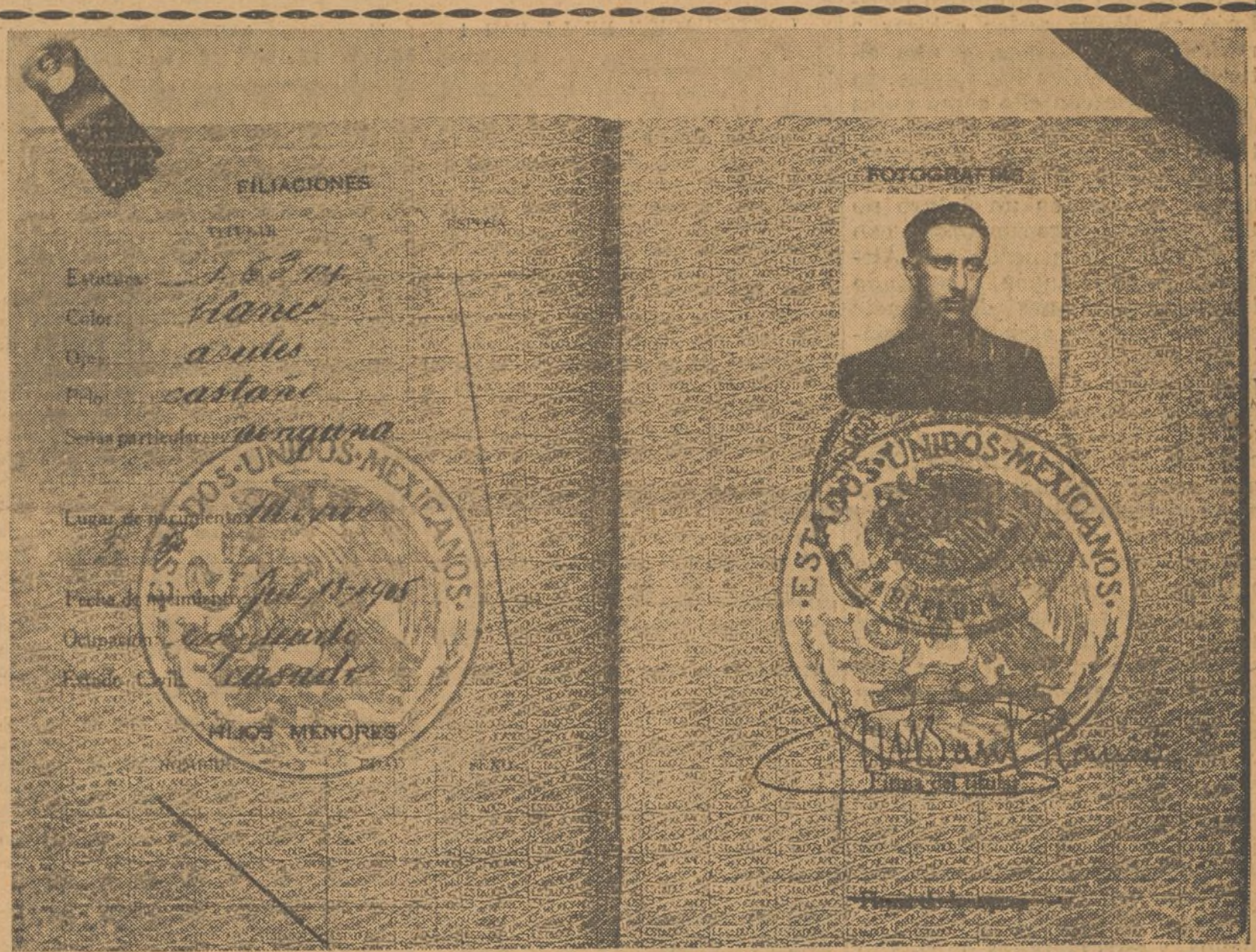
La red de espías que los fascistas españoles tienen en el Sur de Francia es extensa. La constituyen agentes de diversos países. Conocemos detalles de la organización y los nombres de los agentes. Todo lo conocerá el lector en los sensacionales y documentados reportajes que comenzaremos a publicar en nuestro próximo número