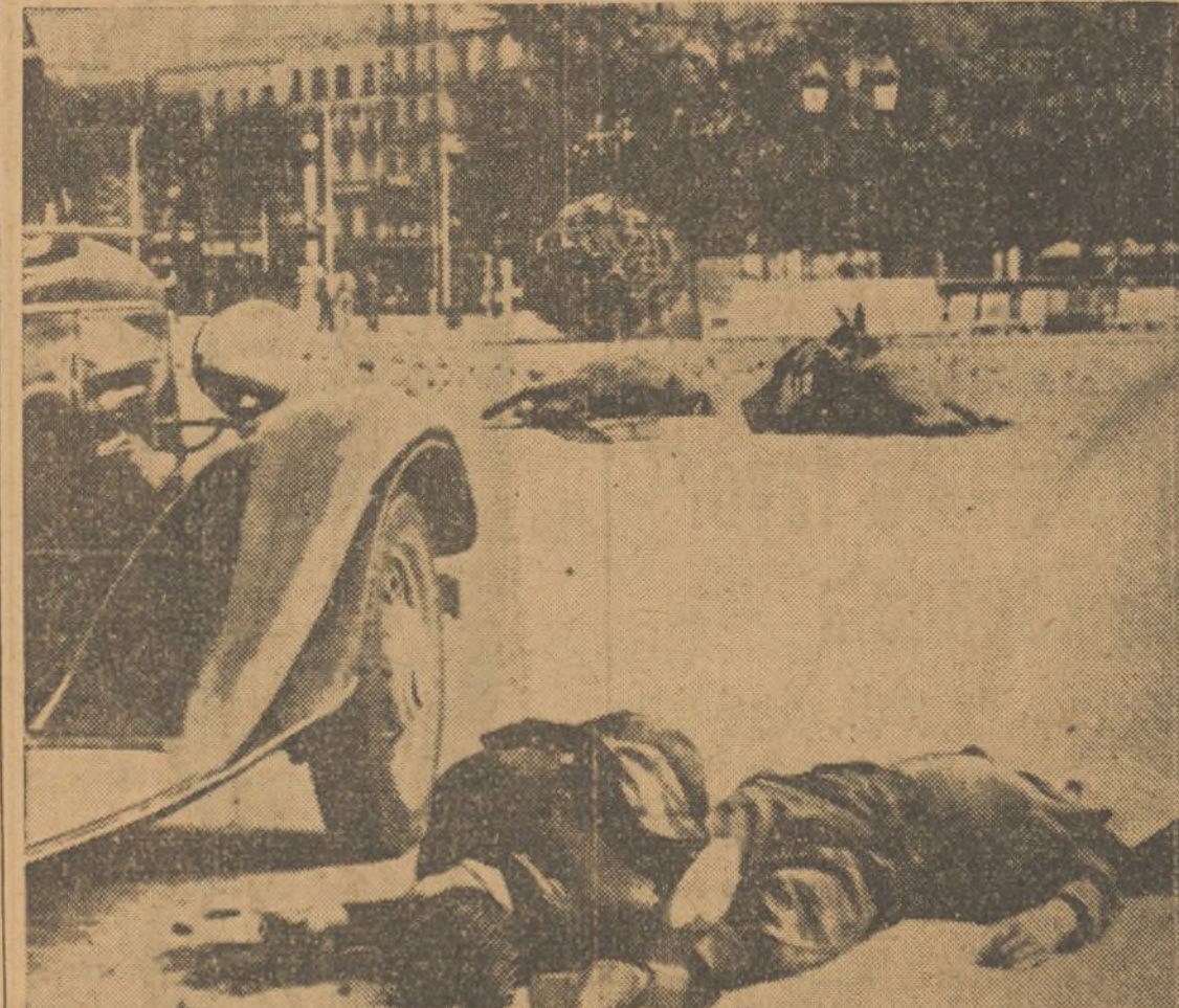
20 de Julio de 1936. Una plaza de Madrid y en ella los cadáveres de dos obreros. Son de las primeras víctimas del militarismo sublevado que solo se apoya en una razón: la metralla

Si Franco no penso en la posibilidad de que el Pueblo en armas le opusiera una victoriosa resistencia... es un imbécil. Si lo penso... es un criminal. Nosotros creemos que lo atisbo, solamente. En una palabra: que es tonto y malvado.