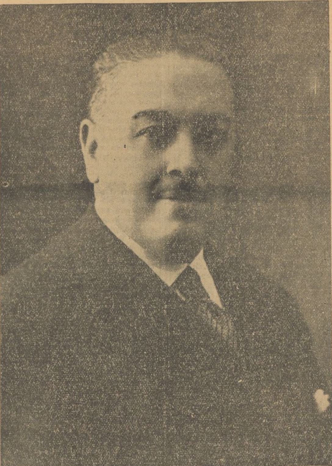
Al periódico «Republica» es obsequio de esta causa en la terna republicana. — Diego Martínez Barrio.

Don Diego Martínez Barrio, presidente del Parlamento Republicano, nos ha enviado, al pie de su fotografía, unas líneas autógrafas alentándonos, para proseguir nuestra labor en el Mediodía de Francia. En este aniversario de la guerra, nosotros reiteramos al Presidente de las Cortes nuestra fé absoluta, en el triunfo de la Democracia.