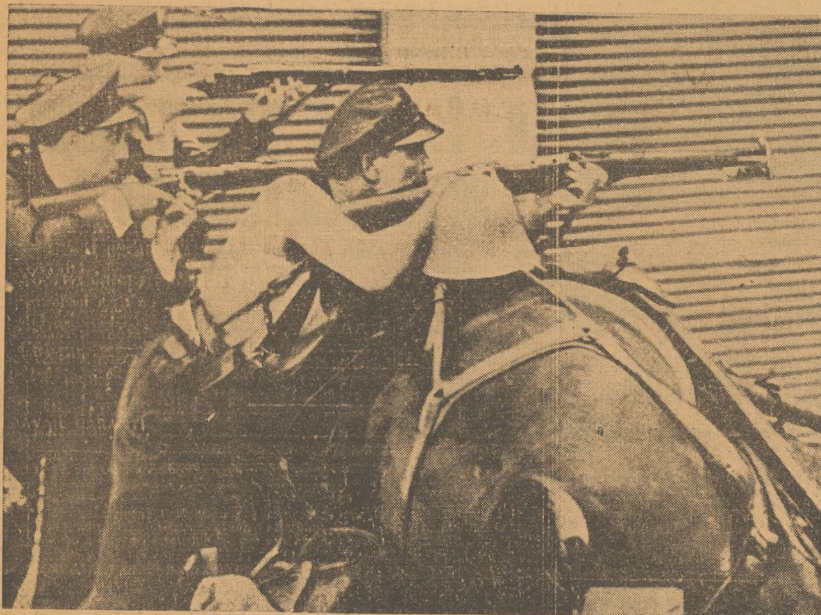
Se faisant un rempart de chevaux tués, les rebelles combattirent longtemps dans les rues de Barcelone, (26 juillet 1936)