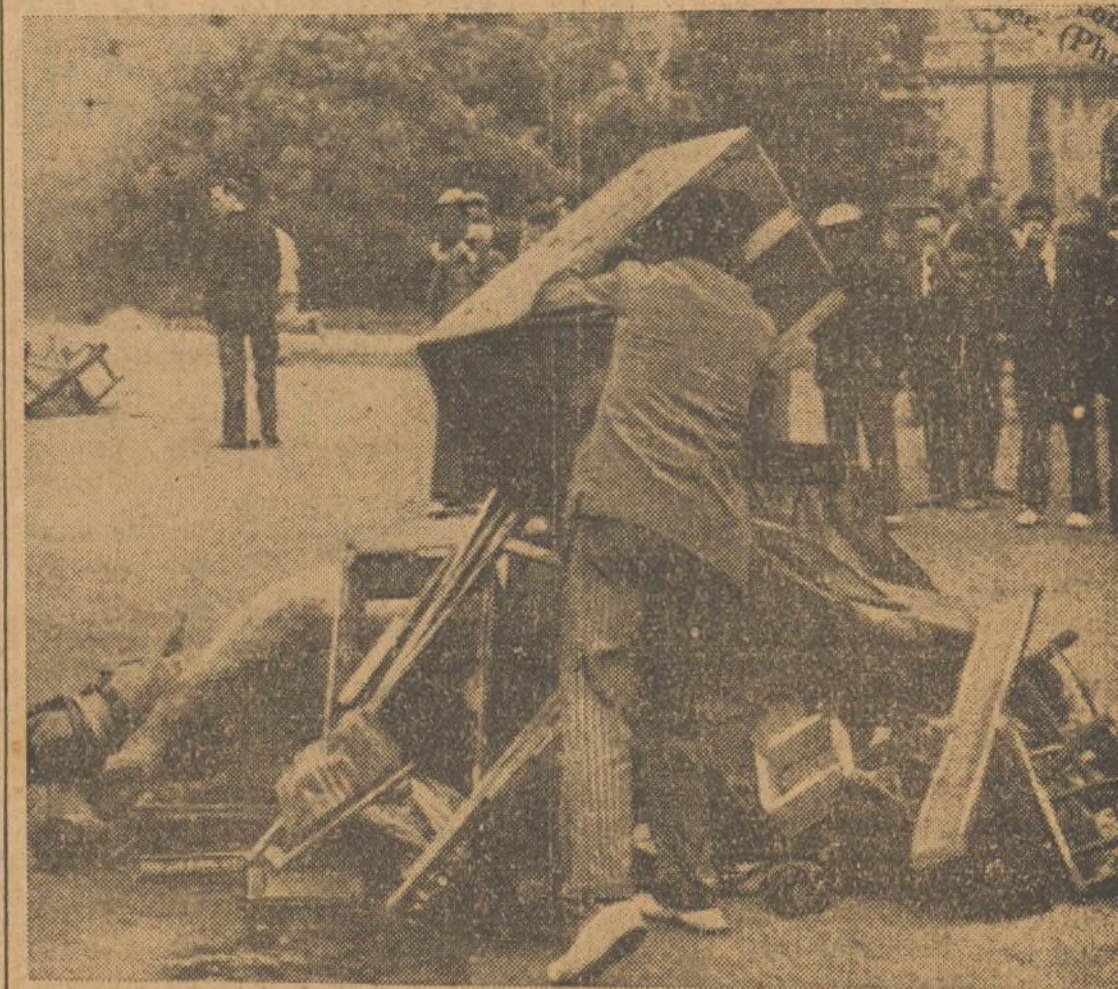
ARRIBA : En Barcelona, las pocas horas en que fueron dueños de algunos lugares de la ciudad, los militares impusieron el terror : caches, detenciones y fusilamientos...