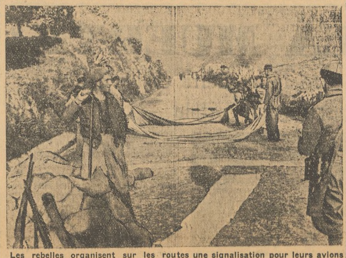
Los rebeldes organizan sur las routes una señalización para sus aviones

R. C. Por la transcripción: F. de LA FUENTE.