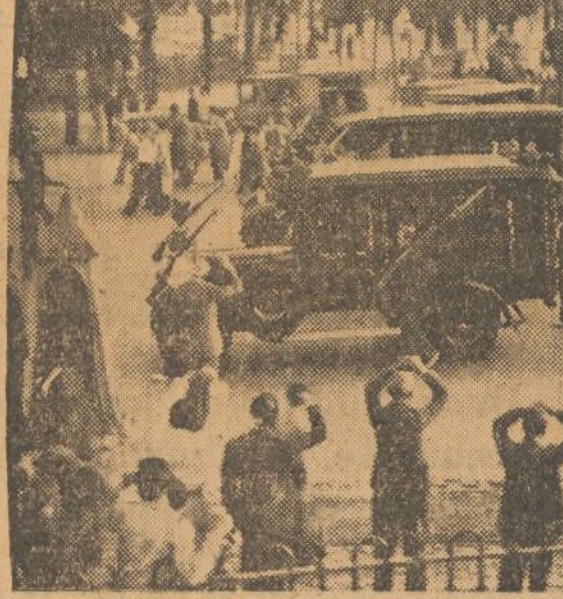
En silencio, los leales honran a las víctimas del fascismo

Así fué lo de las enfermeras de Peguerinos. No pueden, en la retirada momentánea, evadirse del pueblo. Una mujer de este, en la confusión de «¿Qué llegan! ¡Que lleguen!», las sugiere quitarse las batas sanitarias—que el enemigo odia especialmente—y fingirse gente neutra, que veranea en el lugar. El truco ingenuo no sirve para nada. Los