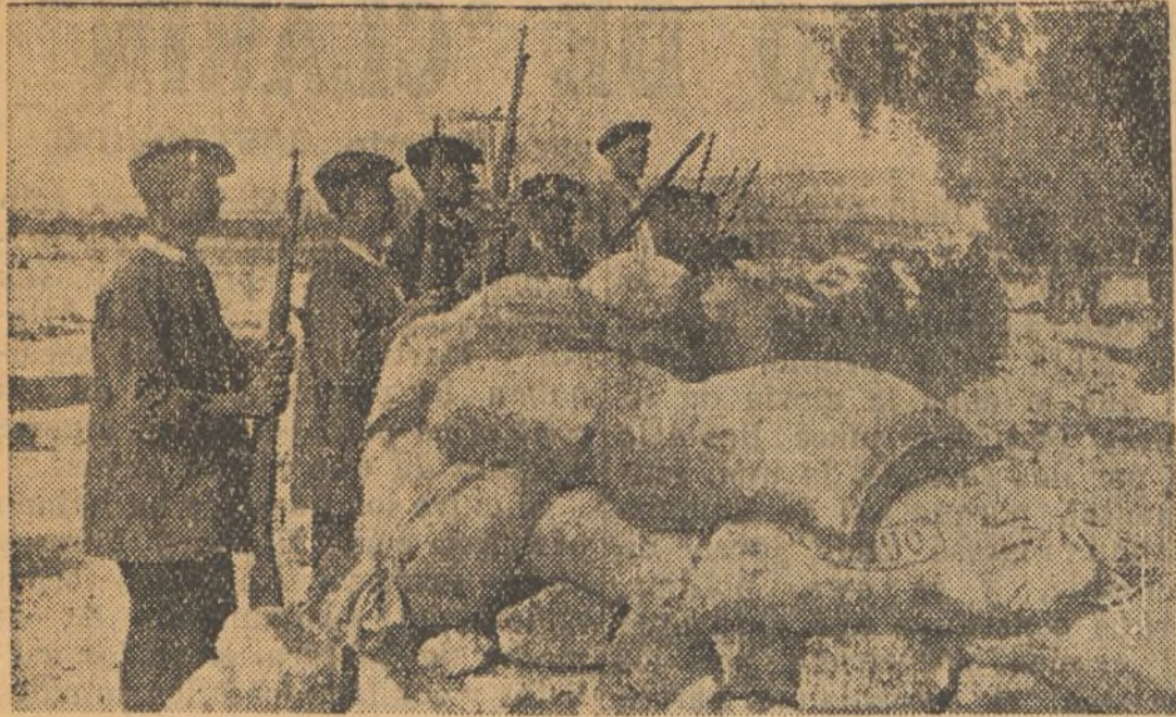
Una barricada sur le front de Navalmoral