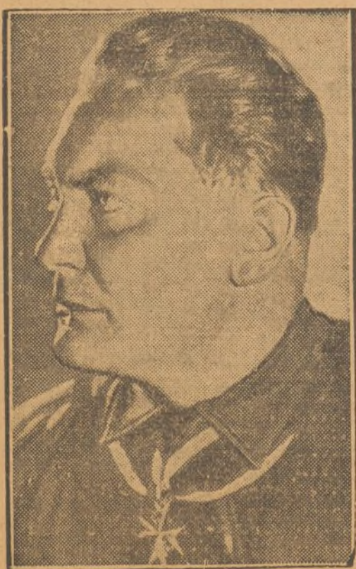
Le général Goering, âme damnée d'Hitler, dont les surenchères ont souvent mis en péril la paix

Par la voix de son représentant au Comité de non-intervention à Londres, la France a fait entendre sa volonté :