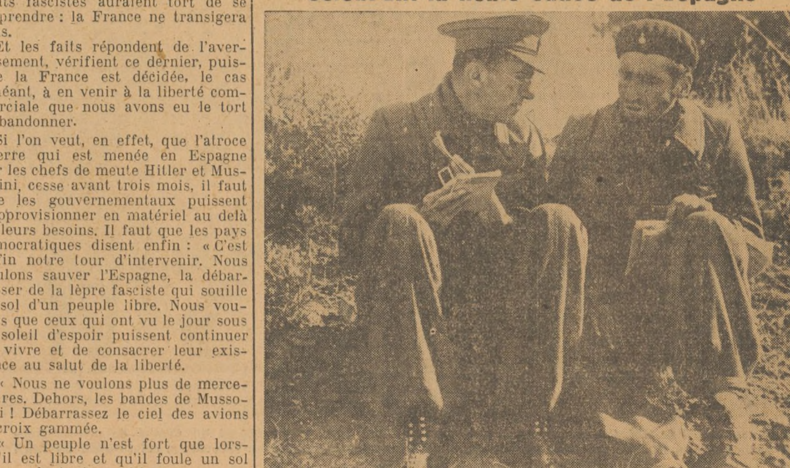
Ludwig Renn, représentant les écrivains antifascistes allemands, à la réunion de Valence. On sait que le célèbre écrivain sert dans les armées républicaines ; on le voit sur notre photo (à gauche) en grande conversation avec un milicien, sur le front de Madrid.