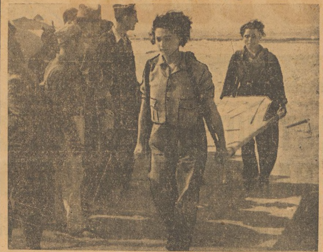
Nuestras mujeres están prestas a recoger los cadáveres de los rebeldes.