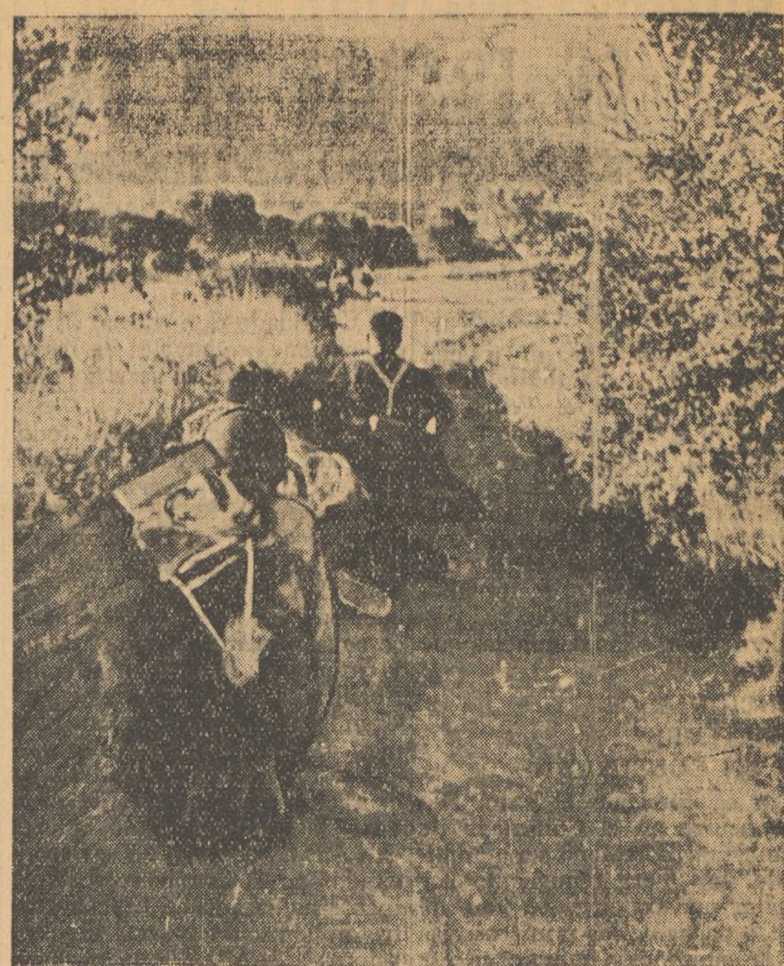
A 500 mètres de Huesca, un groupe de miliciens en embuscade dans un sentier, attend l'ennemi