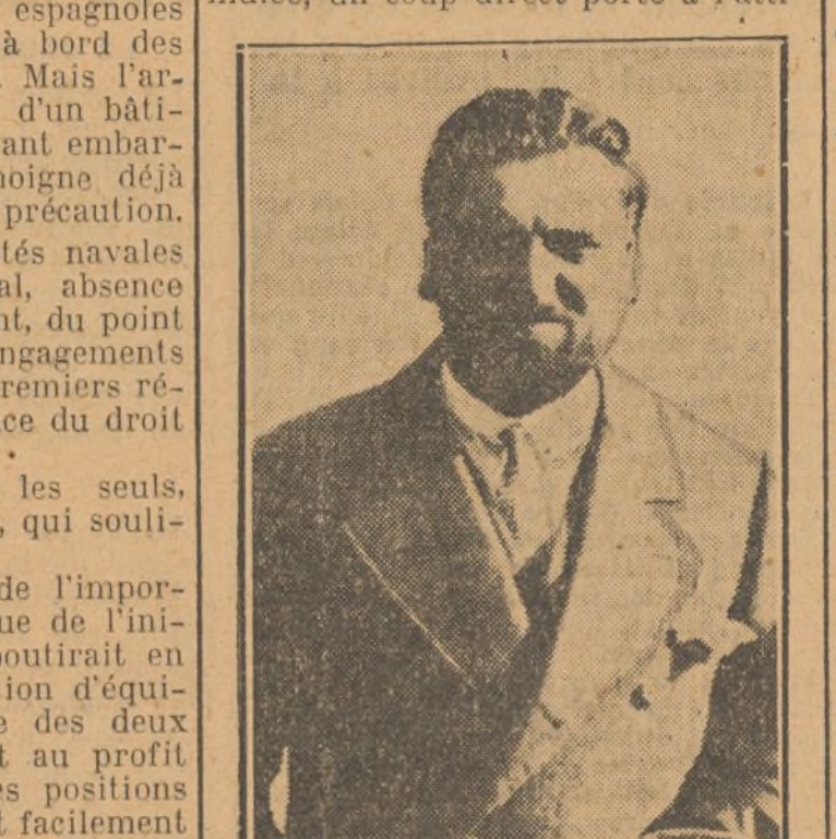
L'ambassadeur d'Italie à Londres

tude du Portugal, attitude qui nous permettrait, par la suite, de nous désintéresser, à bon droit, du contrôle dont la France avait la charge sur les frontières des Pyrénées.