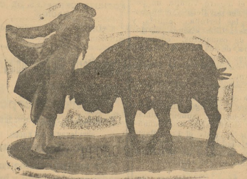
Carreño toreando por gaoneras con su arte inimitable. En esta suerte fué cogido por el miureño en la Plaza de Ecija, resultando con la cornada que le ha llevado al sepulcro

Pero nos hemos puesto a hablar del Litri y es Carreño quien nos espera. Perdónenos la distracción en gracia al punto de contacto que entre él y su pobre paisa-