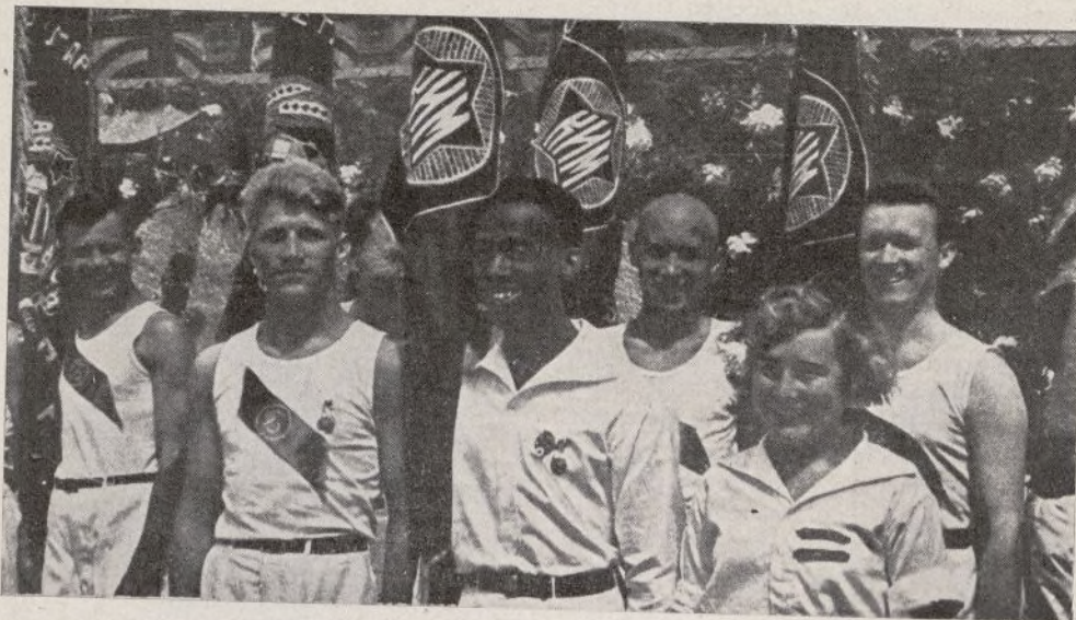
Jóvenes de la U. R. S. S., sanos y fuertes por la práctica constante de la cultura física, demuestran al mundo la fortaleza de sus músculos de acero siempre que organizan un festival deportivo.

Durante mucho tiempo, y por todos los medios a mi alcance, he procurado que la gimnasia, el deporte, las competiciones atléticas, en una palabra, la Cultura física, compendio de todo lo que a ejercicio se refiere, fuera practicado por todos los camaradas que componen nuestra Brigada. Con ello quería conseguir el mejoramiento físico y moral de todos nuestros camaradas. En anteriores artículos he dicho ya que tan necesaria como la capacitación cultural y militar es la Cultura física. De poco nos