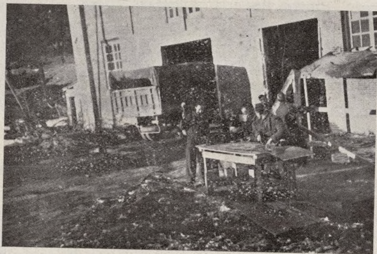
Los días que hace sol se montan los talleres al aire libre, donde se trabaja con más gusto y se da mayor rendimiento.

un coche; hoy son todos buenos conductores y mecánicos expertos.