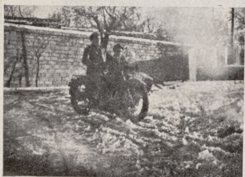
El motorista, firme y seguro sobre su caballo de hierro, desafía todos los peligros.

Cuando vemos partir, raudo, carretera adelante, al motorista montado en su máquina de hierro, no pensamos en el aire que azota su cuerpo ni tampoco en el estado de la carretera, que en el tiempo actual es un peligro constante