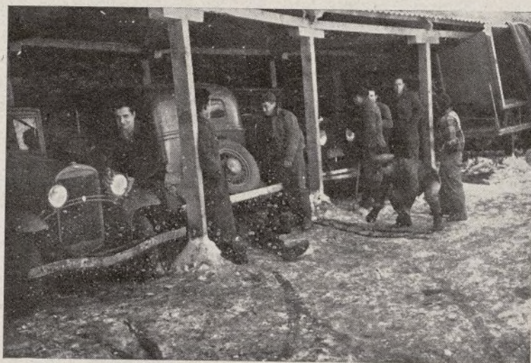
Vista de una cochera. Al final, el alavos, construido por estos soldados de la Motorizada.

El motorista tampoco piensa en ello; sólo sabe que tiene que llevar un mensaje a deter-