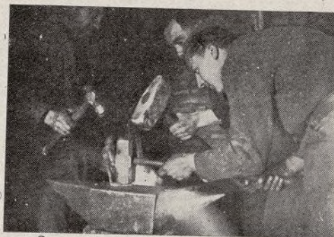
Un trabajo delicado, ¿verdad? Hay que dar gol-pes con precisión matemática. ¡Cuidado con lo que hacéis, que cuesta caro el material!

Cuando dejo a estos hombres una camioneta