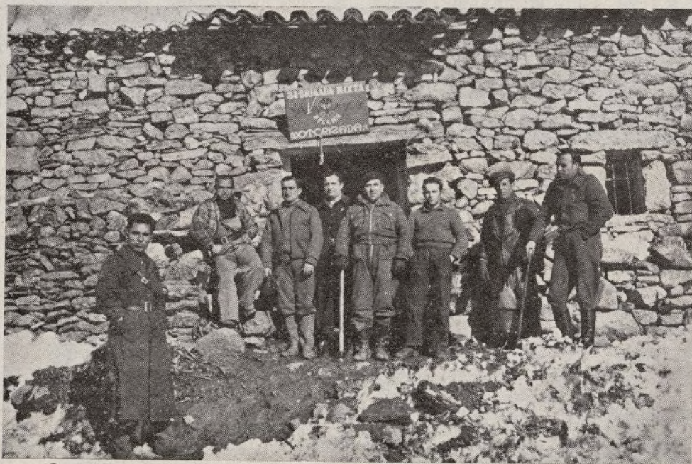
Un puñado de héroes de nuestra lucha: éstos son los hombres de nuestra Motorizada.

Nieve, mucha nieve. Todo nuestro frente está envuelto en ella. Muchos días el frío es intenso. Los heladas se suceden unas a otras. El invierno acaba de aparecer con toda su crudeza. Frío, nieve, aire... Con todo esto tienen que pelear unos hombres que, a primera vista, no se le concede importancia a su labor diaria y fatigosa.