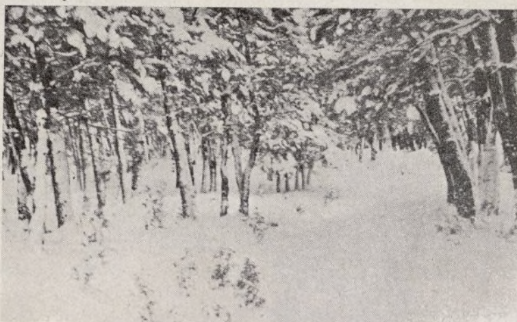
El año nuevo se presentó con una intensa nevada, elemento contra el cual tienen que luchar nuestros soldados.

Gráfica Administrativa, C. O.—Rodríguez San Pedro, 32.—Teléfono 41813.