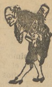
A los pies de Vd.

El maravilloso baño de pies, es la salvación de los delicados pies de la mujer. Permite llevar calzado ajustado sin que se HINCHEN, RECALIENTEN o DUELAN los pies, juanetes o callos por mucho que se ande, pues aumenta considerablemente su resistencia al cansancio y al calor. Lea estas pruebas irrefutables: