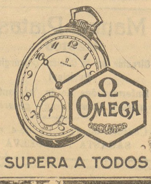
SUPERA A TODOS

Diatermia Consulta de 10 a 11 y de 2 a 4 Castelar, 86