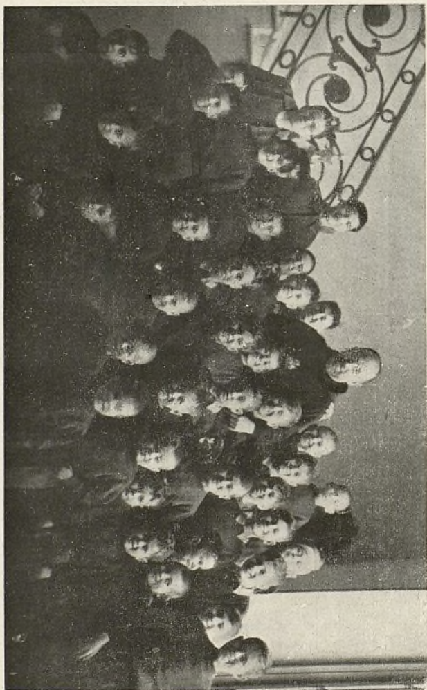
El semblante de los niños que recoge esta fotografía denota la satisfacción y la alegría que recibieron al facilitárseles ropa nueva, donada por nuestra Beneficencia