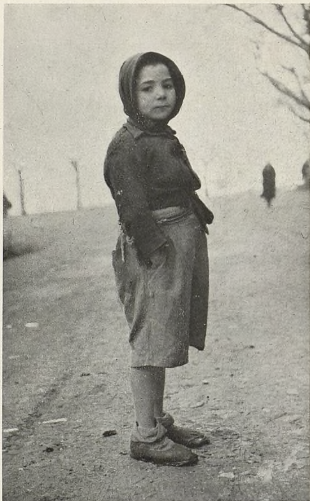
Uno de los muchachos atendidos por la Beneficencia antes de ser vestido con el equipo de ropa que le fué facilitado