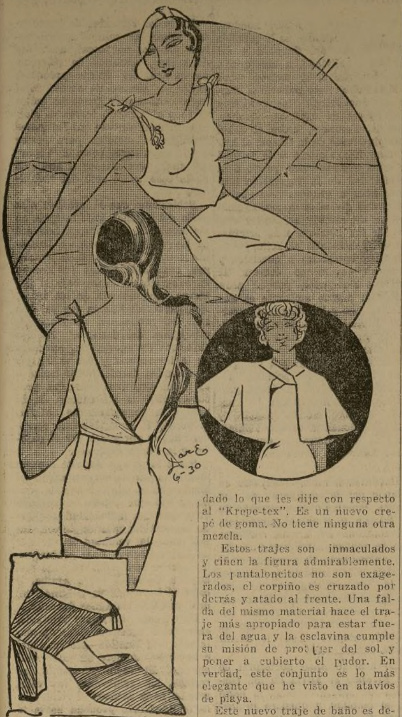
Más trajes de baño

El magnífico material de goma de que les hablé hace días, llamado "Krepe-tex", ofrece a las mujeres de buen gusto el traje de baño, en blanco, ideal. Los pantalones y corpiño ceñido, adornado con una diminuta rosa roja, la gorra al estilo Le Monnier, la esclavina y los zapatos de "panamode", forman un encantador conjunto.