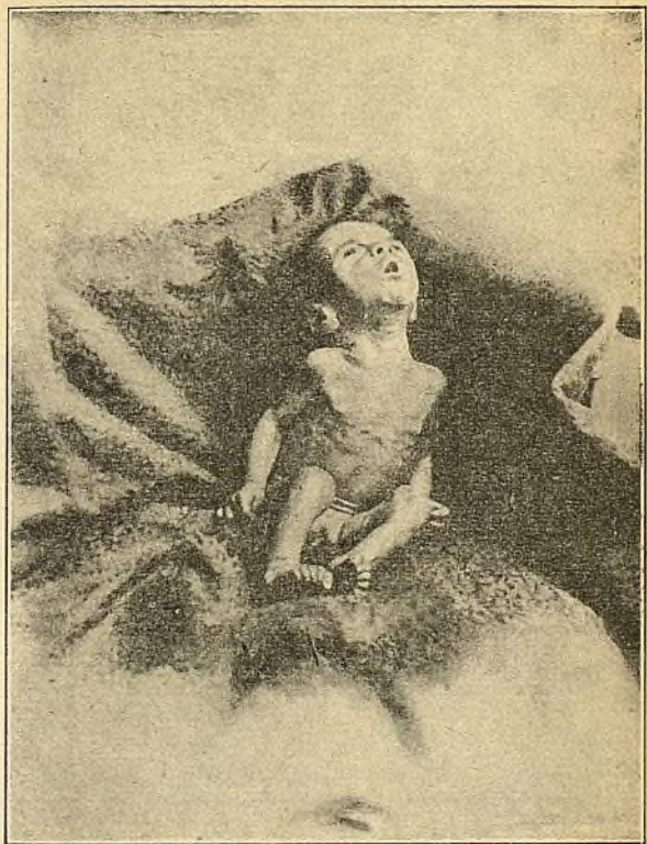
Niño atrépsico (encanijado) de dos meses con peso de 2.280 gramos, alimentado desde el na- cimiento con leche de vacas y papillas.