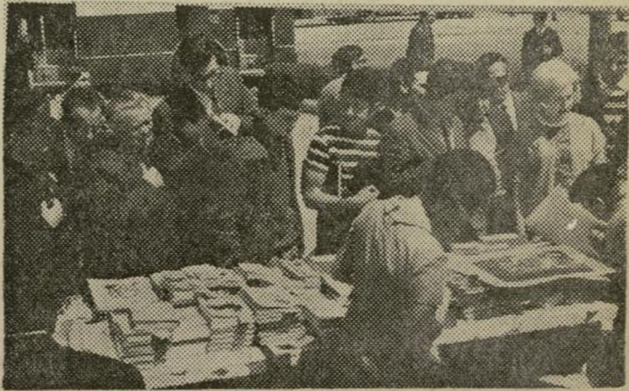
Libros: curiosidad callejera

Era una inmensa librería. Un escaparate que comenzaba tímidamente en los primeros números de la Gran Vía, continuaba y crecía al mismo ritmo de la numeración y alcanzaba su máximo exponente hacia la plaza del Callao. Ciertamente había muchas más tiendas, más pequeñas, más espaciadas, más salteadas a lo largo y a lo ancho de Madrid, y siempre al aire libre, pero la principal estaba en eso que los cronistas llaman "arteria central" de la ciudad, y que ayer también era el centro cultural de la misma.