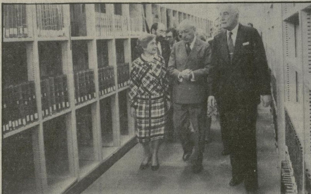
Tierno visitó las nuevas instalaciones

Especial cuidado ha merecido el dotar de medios adecuados al citado centro, que posee 2.161 armarios metá-