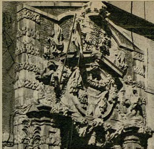
La bella portada churrigueresca, obra del arquitecto Pedro de Rivera

1) Por su calidad arquitectónica del edificio, sobradamente merecedora de la declaración de monumento nacional. 2) Por el respeto del entorno urbano. Cada pieza del conjunto urbano es parte del patrimonio cultural de la ciudad. Frente al derribo por el derribo, deberíamos pasar de una vez a la conservación por principio, mientras no haya razones válidas y fundadas para derribar. Para conservar no hacen falta razones. Se precisan razones, y muy claras, para derribar. 3) Por el equilibrio de la trama urbana del barrio. La naturaleza residencial del barrio se vería destruida en caso de