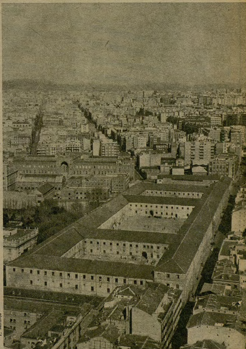
Vista panorámica de la zona del cuartel de Conde Duque en su actual aspecto

Recientemente, el Colegio de Arquitectos se pronunció en contra del derribo del cuartel y propuso la creación de un patronato regido por el Ayuntamiento, Coplaco y la Dirección General de Bellas Artes para su conservación y restauración. Crear un vacío urbano, construir un centro de atracción pública y un aparcamiento contribuiría, dicen los madrileños, a colapsar una de las zonas peor preparadas urbanísticamente de Madrid. Hemos recogido varias opiniones destacadas sobre el cuartel de Conde Duque, algunas de ellas de partes interesadas en el mismo.