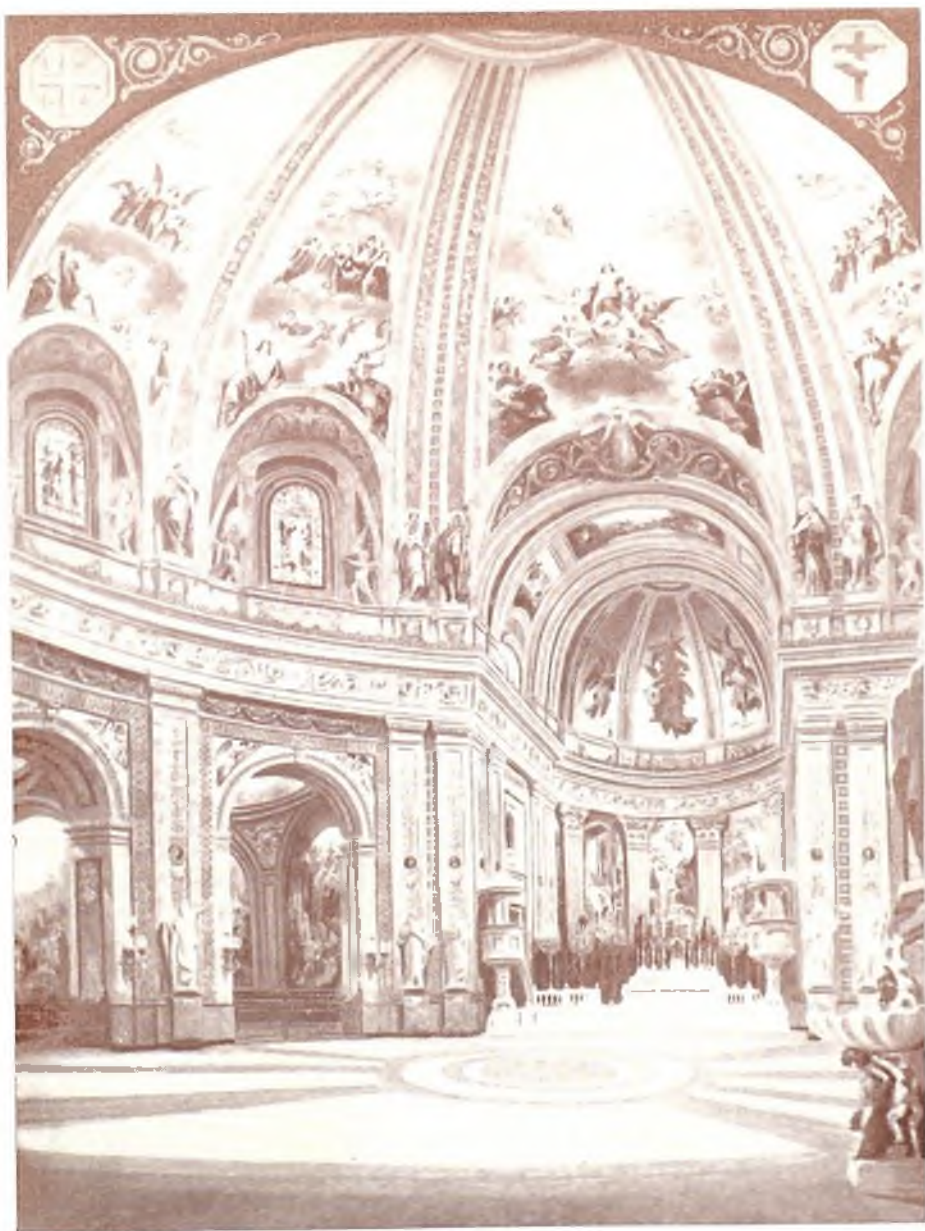
Iglesia de San Francisco el Grande