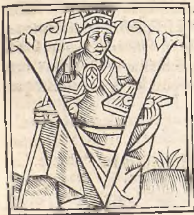
Helie ptinax empereur,

¶ Victor quinziemesme Pape & premier du nom,