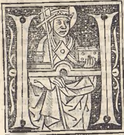
La mort de Boece

Ormisdas estoit du pays de Frise, Son pere auoit nom Iuste, Il fut au tēps que Boece & Symmache beau pere de boece/ estoient consulz de la ville de Romme, Lesquelz Theodorice enuoya en exil/ & puis les rappella & les tint lōguement en prison: Ou boece fist & cōposa plusieurs beaulx liures Il auoit cōmence Aristote: il fut grāt clerc en la science mathematique/ & musique, Ses oeures sont en la crestiēte vulgaires & notoires, Et finalement fut tue & occis/ & avecques luy Symmac senateur p