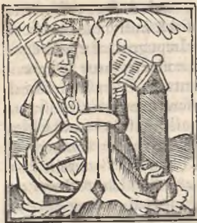
Creation de cardinaulx