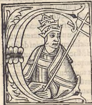
De l'epereur Domicien,

◐ Clement premier du nom, IIII, pape de Romme,