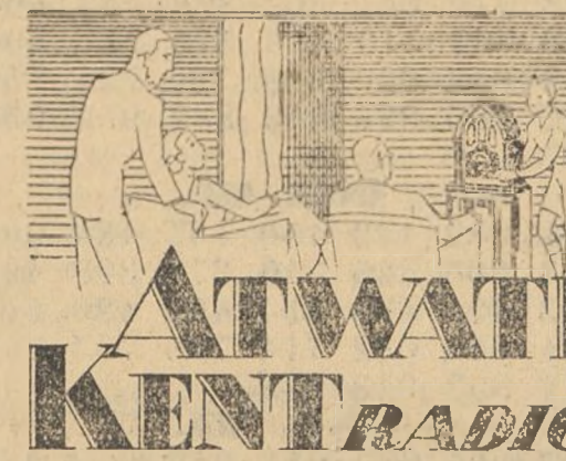
Elegante modelo compacto, superheterodino con periodo variable Mu y altavoz dinámico "La Voz de Oro".

Hay muchas marcas de radio de calidad variable, las hay buenas, pero lo cierto es, que a la cabeza de todas ellas, ha figurado ATWATER KENT por espacio de ocho años.