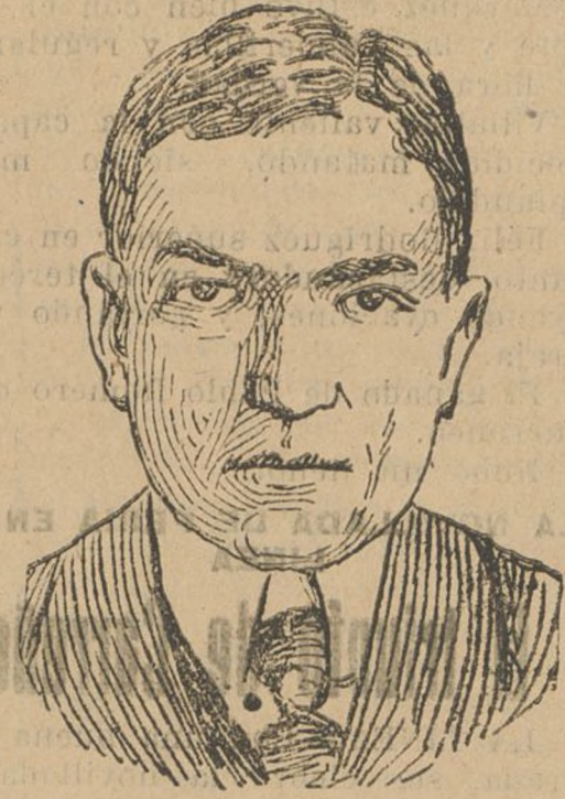
Mr. John D. Rockefeller, famoso filántropo norteamericano y uno de los candidatos con más probabilidades de ser nombrado alcalde de New-York

adivinar la competencia y el arte del autor del proyecto.