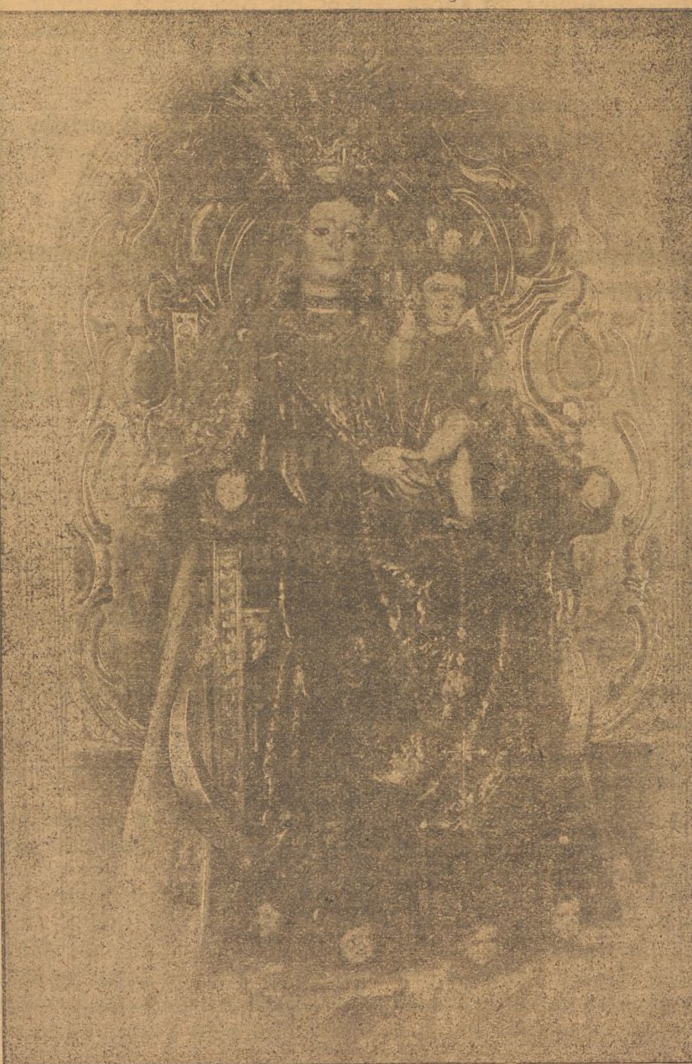
Nuestra Señora de la Bella