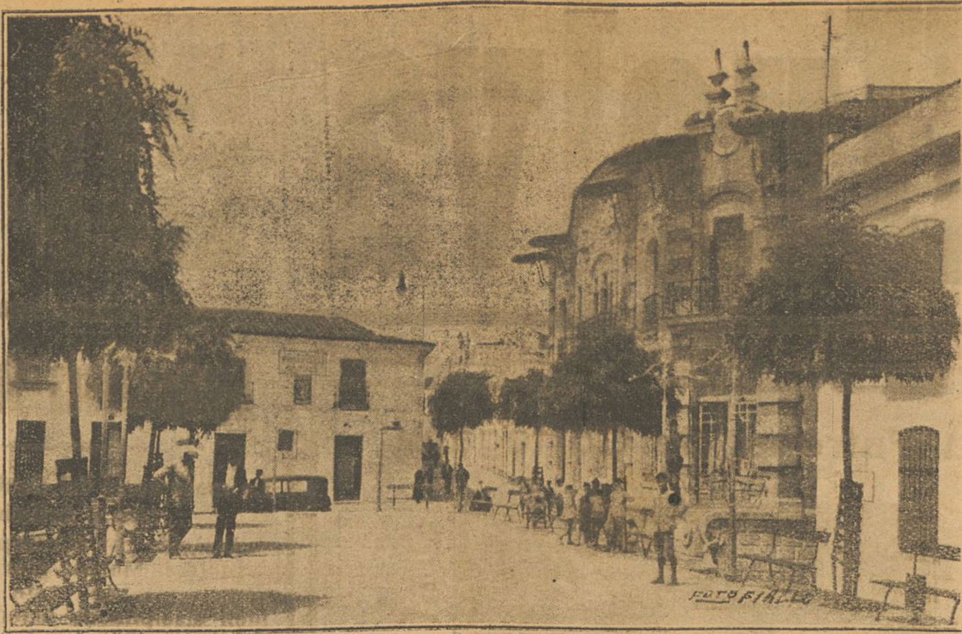
CORTEGANA.—Plaza de Albareda