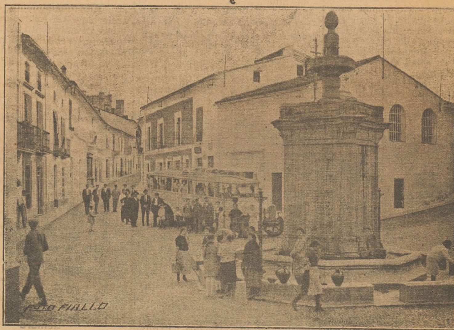
CORTEGANA.—Plaza de la Constitución