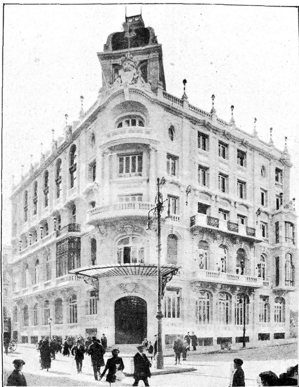
Fachada a la Gran Vía.