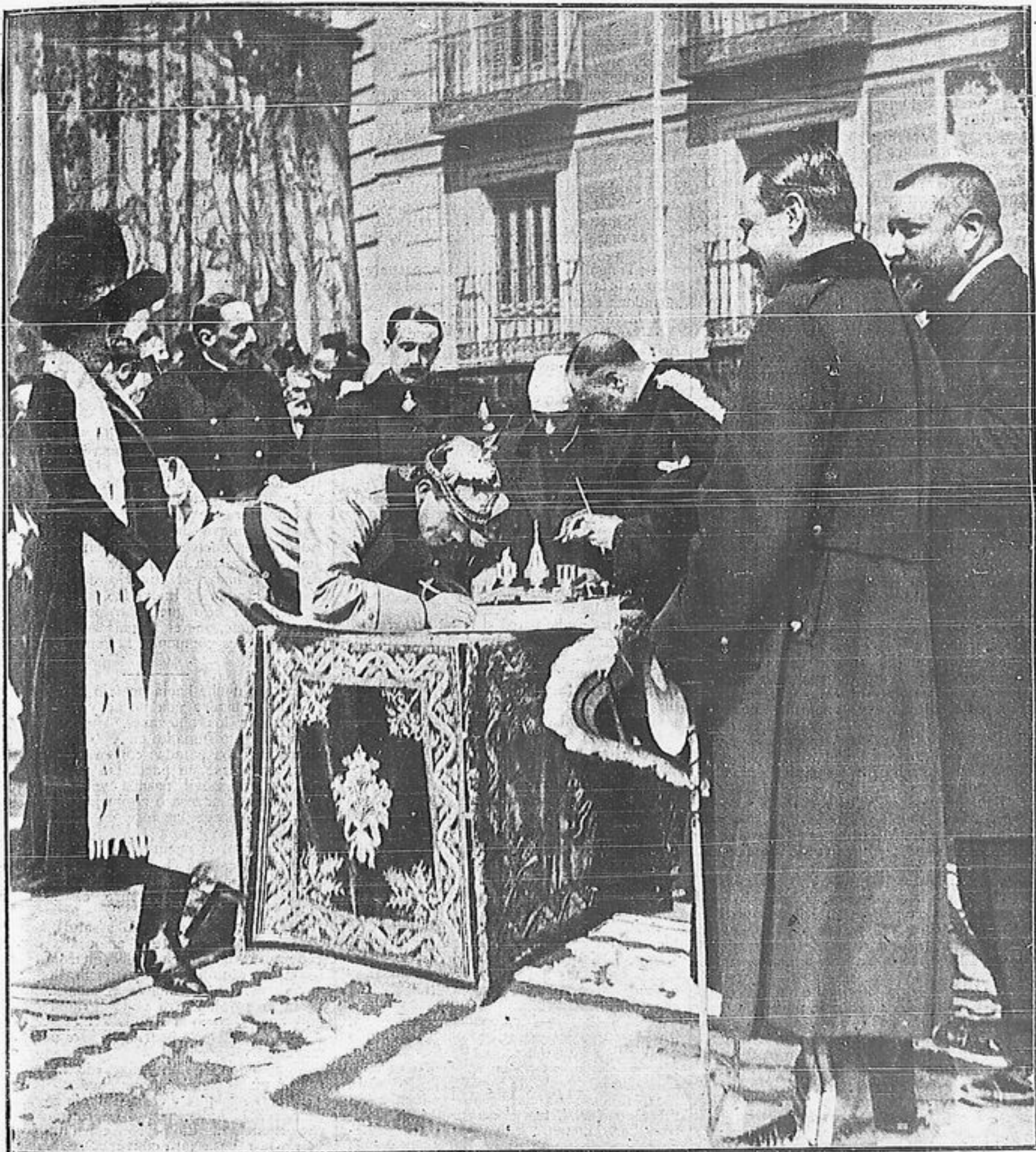
LA INAUGURACION DE LAS OBRAS DE LA GRAN VIA SU MAJESTAD EL REY FIRMANDO EL ACTA DEL COMIENZO DE LAS OBRAS EN EL LUGAR DONDE SE VERIFICO ESTE AYER MAÑANA

MADRID: UN MES, 1,50 PTAS. PROVINCIAS, TRES MESES, 5. EXTRANJERO, SEIS MESES, 16 FRANCO REDACCION Y ADMINISTRACION: SERRANO, 55. MADRID