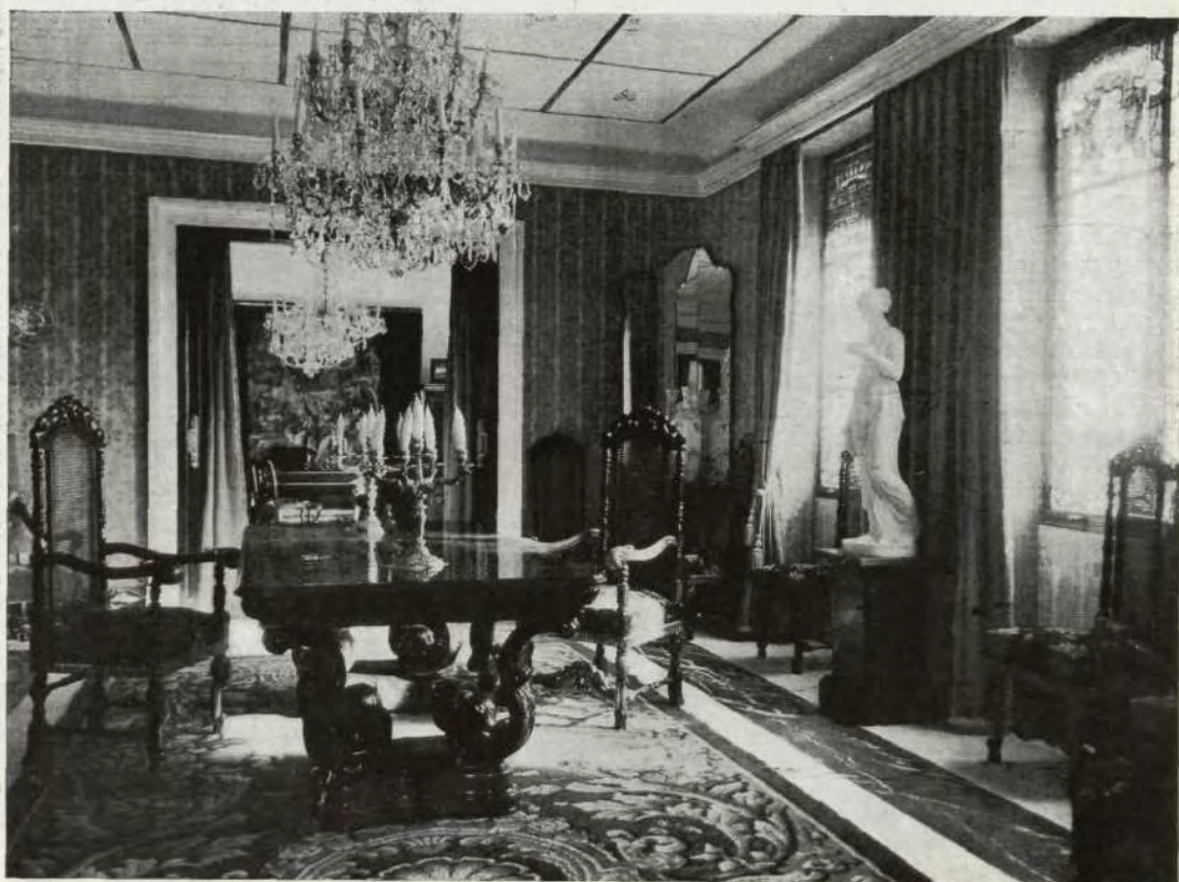
Un aspecto del comedor.