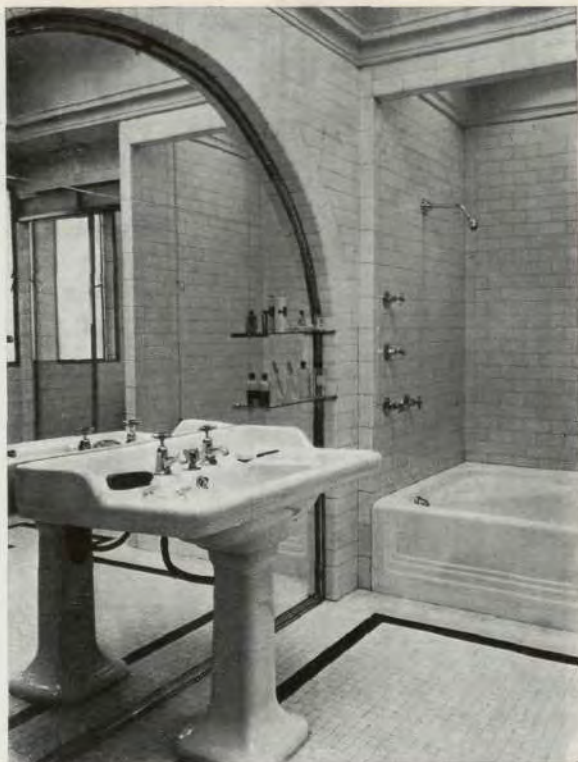
Cuarto de baño.

Si todo en esta casa revela la distinción y el buen arte de sus moradores, es acaso digna de especial atención la reja que separa el vestíbulo del comedor. De hierro limado con aplicaciones de bronce y con medallones — con efigies de los Reyes Católicos, de Carlos V y de Doña Isabel de Portugal—, es una soberbia pieza que podría figurar en un viejo palacio español del siglo XVI.