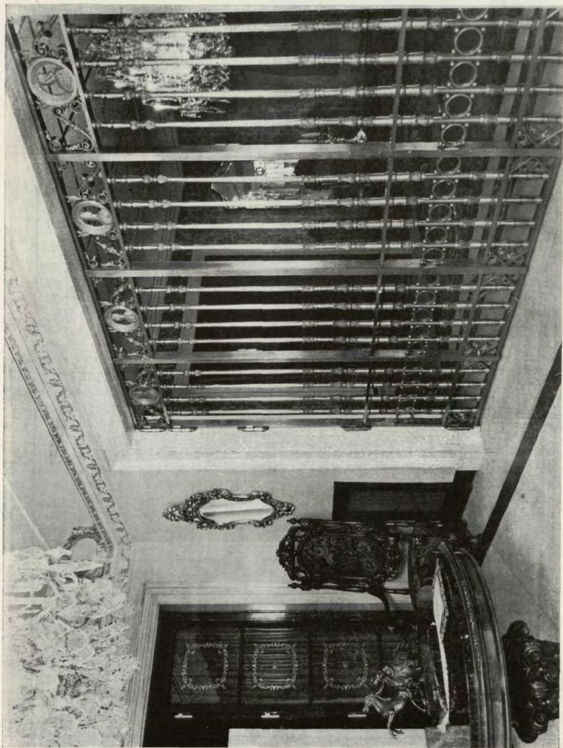
Detalle de la reja del comedor al "hall".