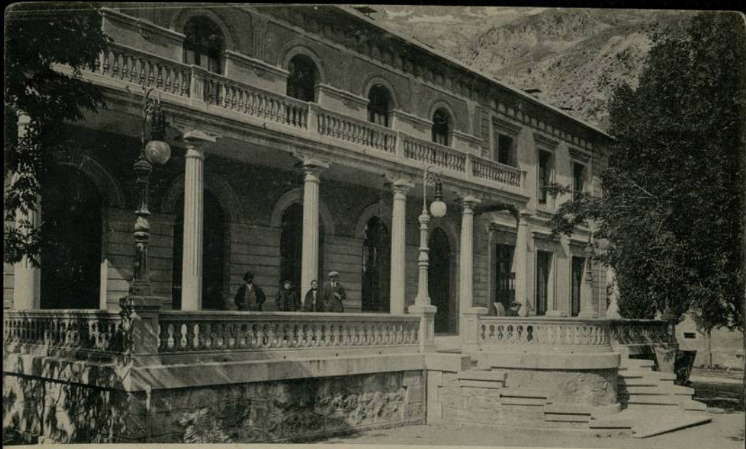
BALNEARIO DE PANTICOSA. Terraza del Casino