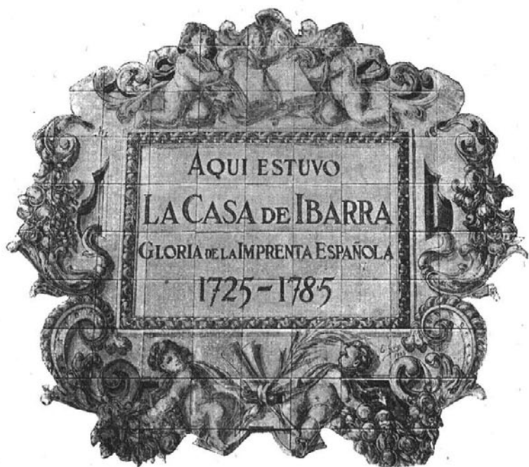
Placa conmemorativa, colocada en la casa número 13 de la calle de Núñez de Arce (22 antiguo de la calle de la Gorguera).