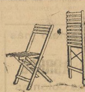
Modelo M. Ptas. 700

A los precios de 9, 15 y 18 pesetas. Únicamente en la Papelería del DIARIO DE HUELVA.