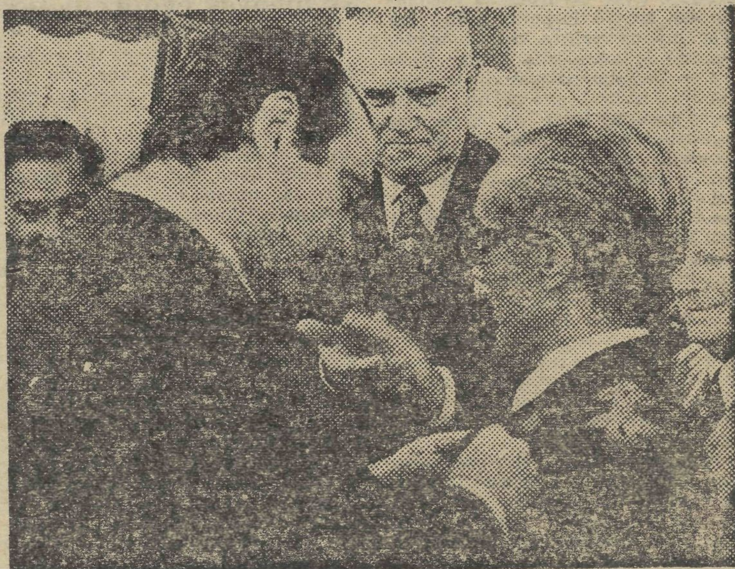
El ministro de Educación y Ciencia impone al director de la Banda Municipal Madrileña la medalla de oro de las Bellas Artes.

Le fue impuesta por el ministro de Educación y Ciencia