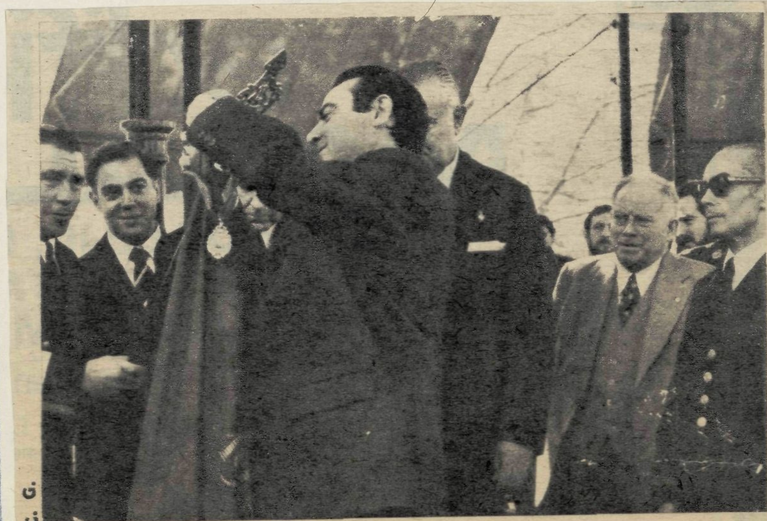
MEDALLA DE ORO A LA BANDA MUNICIPAL. —El ministro de Educación y Ciencia, señor Martínez Esteruelas, ha entregado la medalla de oro de Bellas Artes a la Banda Municipal de Madrid. El acto se celebró en El Retiro.