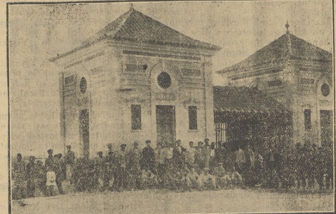
Los obreros parados de Ayamonte formando compactos grupos se estacionan en múltiples sitios; mientras, el hambre se enseño de sus modestos hogares

Sus hombres, trabajadores, pero enemigos de inicuas y absurdas explotaciones, van a ejercitar esos