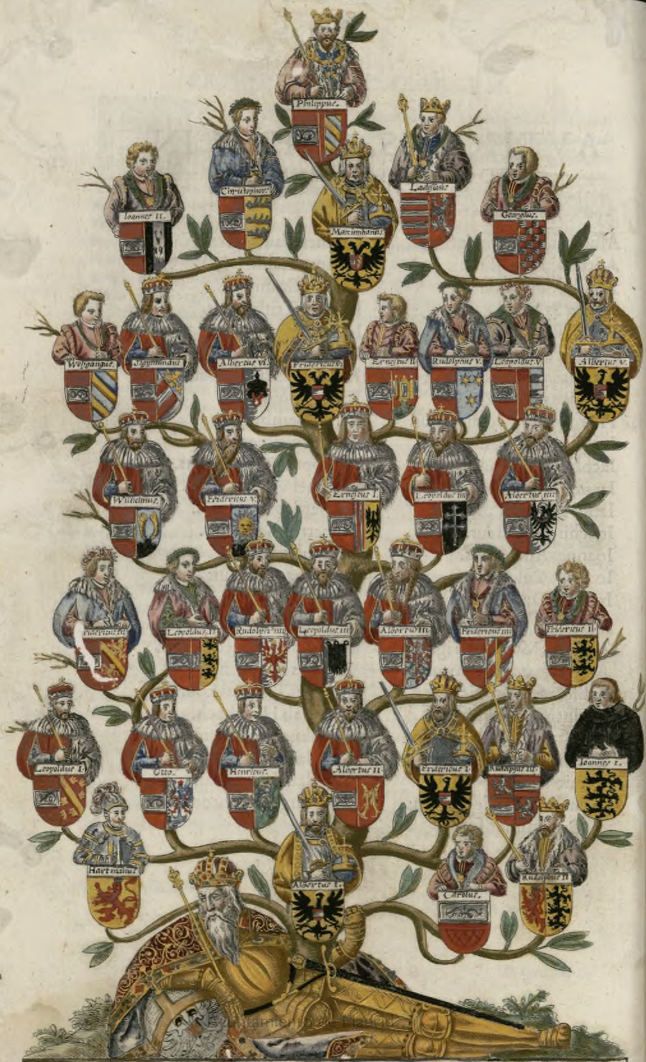
RVDO LPHVS PRIMVS ROMANORVM IMPERATOR.