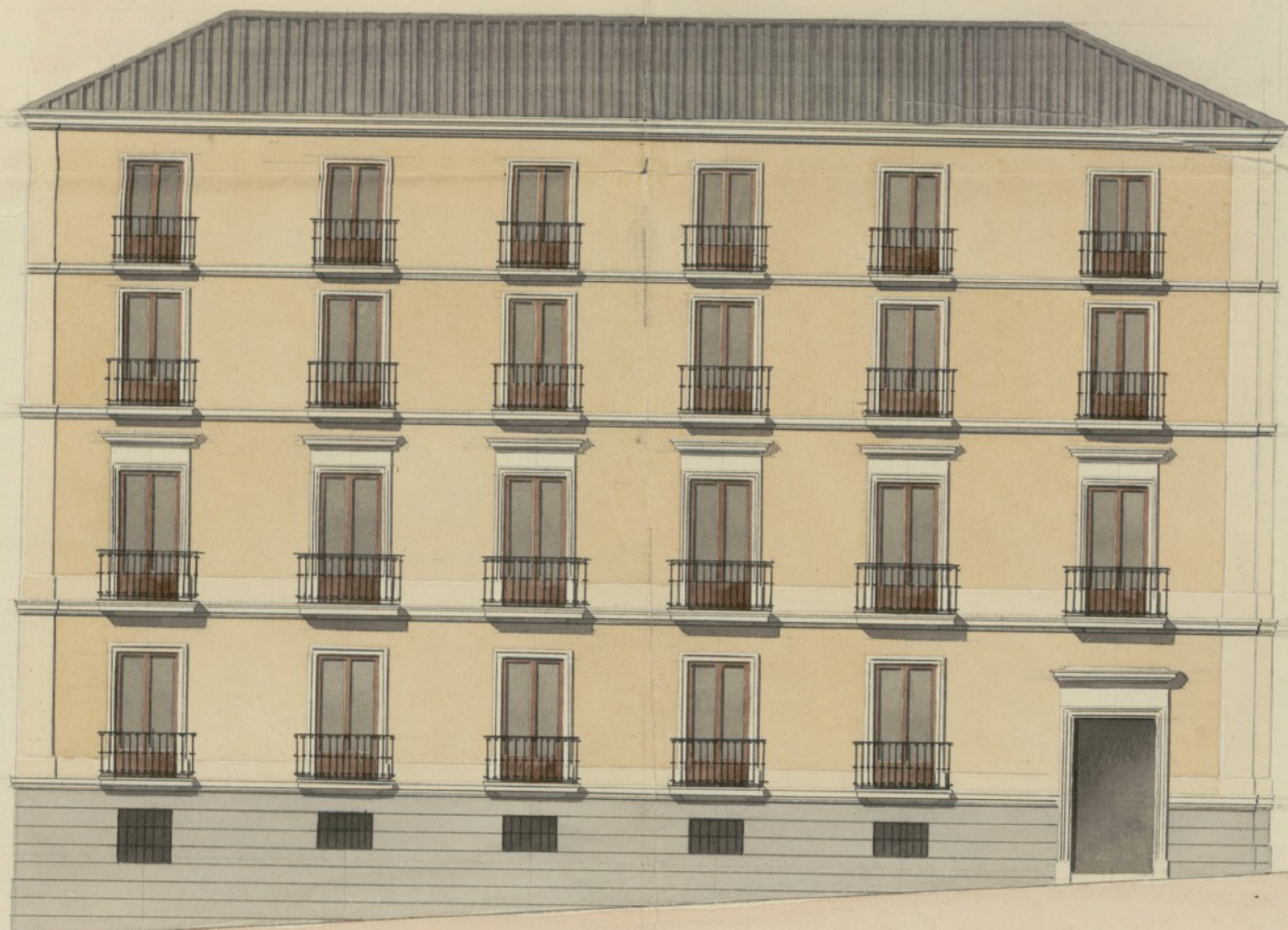
Fachada en la Calle de la Luna en la que se han de construir los dos últimos pisos.