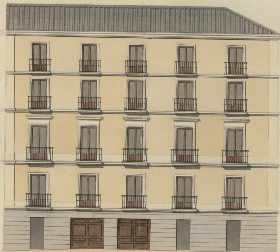
Fachada en la Calle de la Cruz verde en la que se han de construir los dos últimos pisos.

Diseño de las fachadas para la reedificación en parte de la Casa del Exma. Sr. Conde Viudo de Villanueva, sita en las Calles de la Luna, de la Cruz verde, y la de Panaderos, números 40, 2 y 1 de la manzana 481.