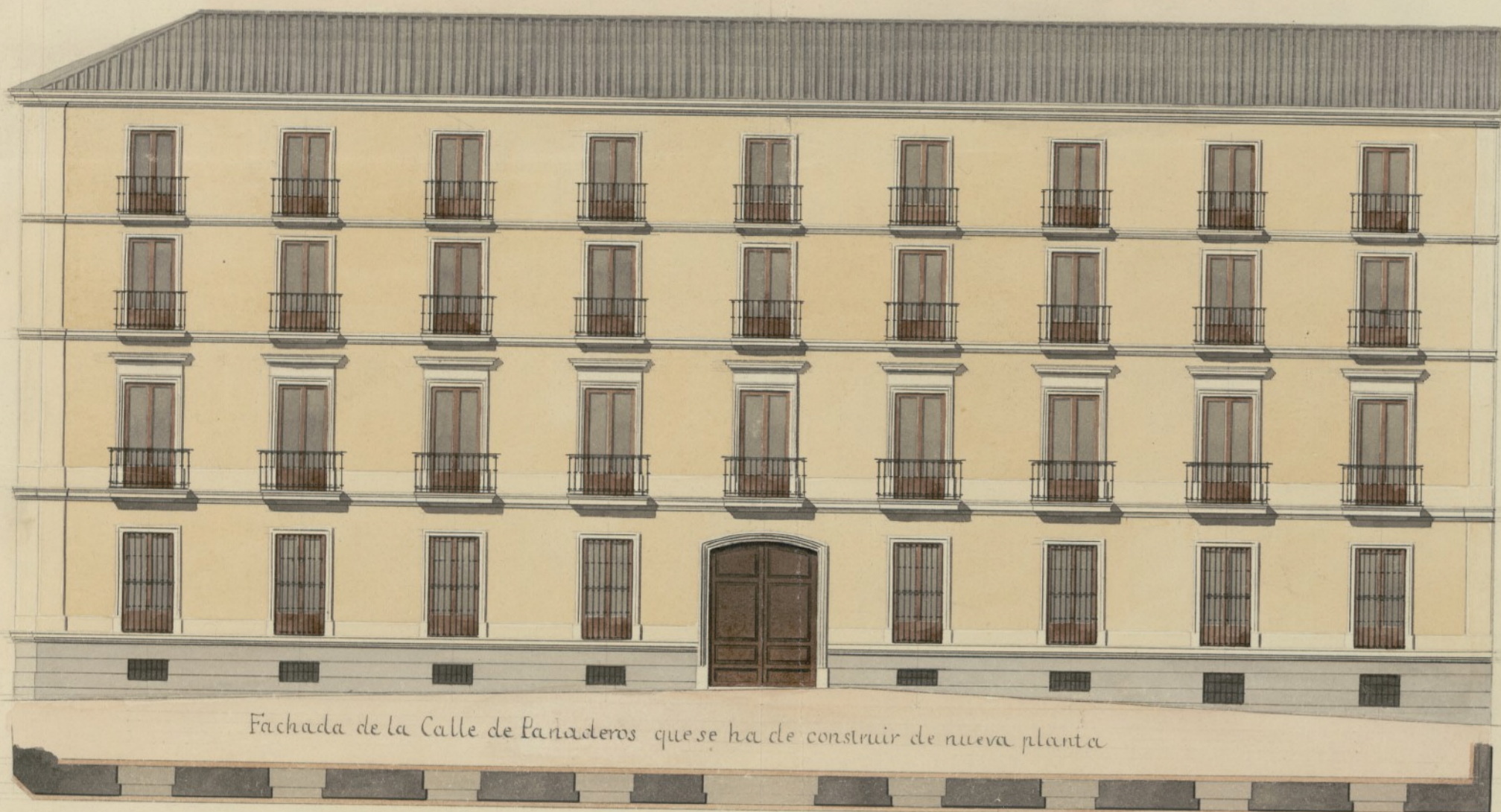
Fachada de la Calle de Panaderos que se ha de construir de nueva planta