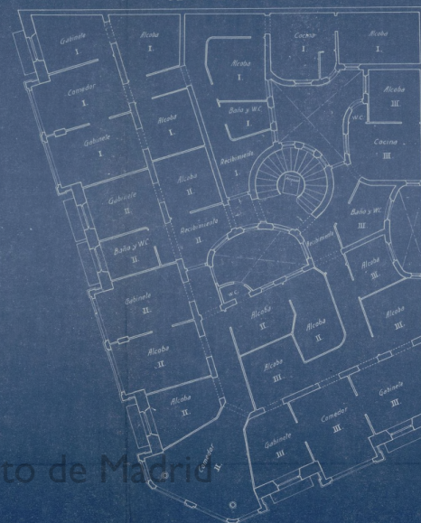
PLANTA DE LOS PISOS.