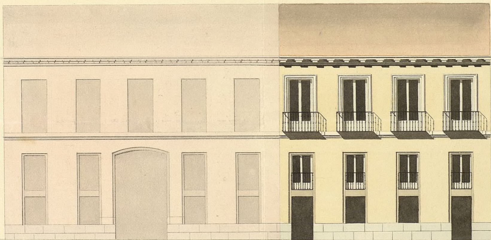
Fachada q. ha de conservarse.