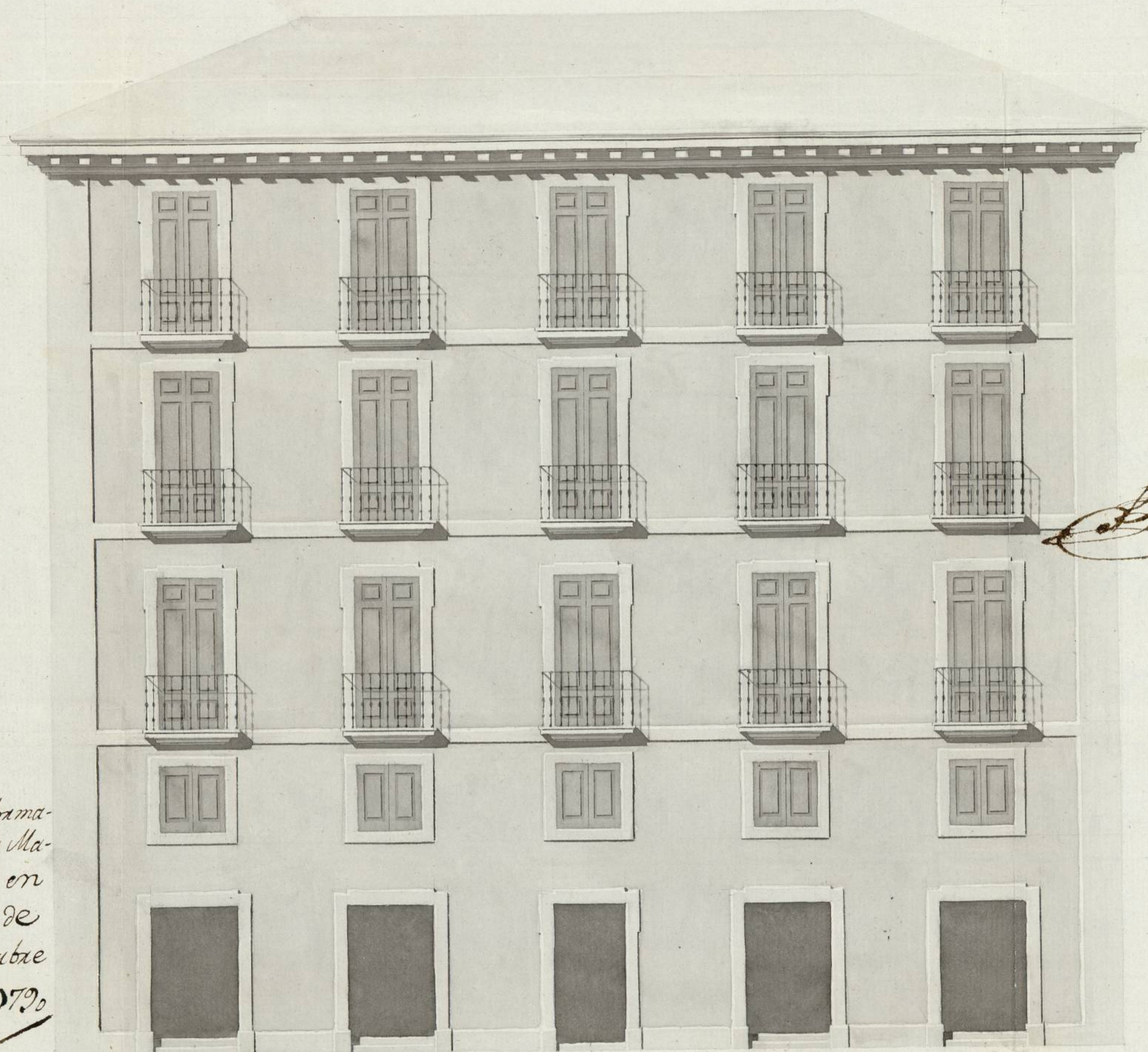
Fachada a la Calle de Perexinos.