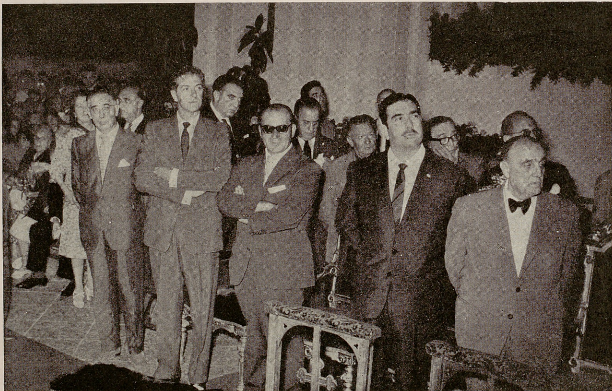
Presidencia oficial e invitados al acto de la bendición de la reconstruída iglesia de San Cayetano, en la tarde del día 6 de agosto de 1962