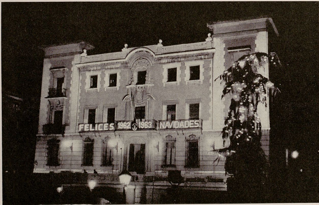
Fachada de la Tenencia de Alcaldía, profusamente iluminada con motivo de los días de Pascua