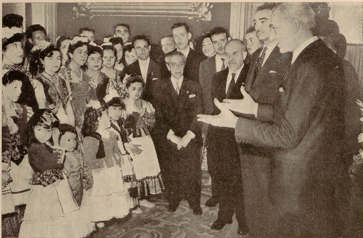
Momento de la entrega de la Cruz de Mayo en el Ayuntamiento en el año 1958