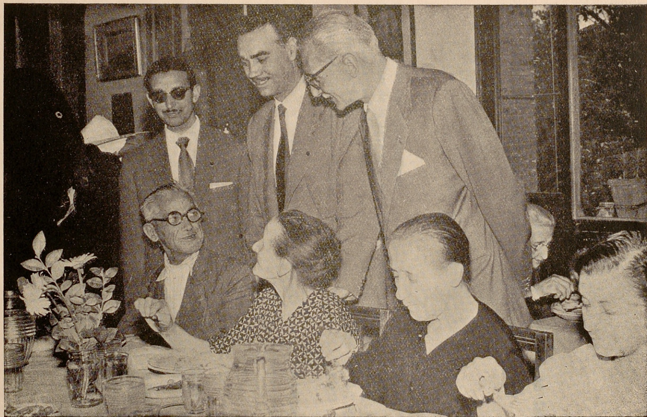
Un detalle del Comedor de Caridad de la Tenencia de Alcaldía, instalado en el paseo del General Martínez Campos, 18. Ayuntamiento de Madrid