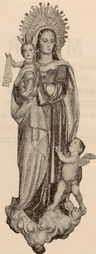
Imagen de Nuestra Señora del Carmen, Patrona de Chamberí, que se venera en la iglesia parroquial de Santa Teresa y Santa Isabel, de Madrid.