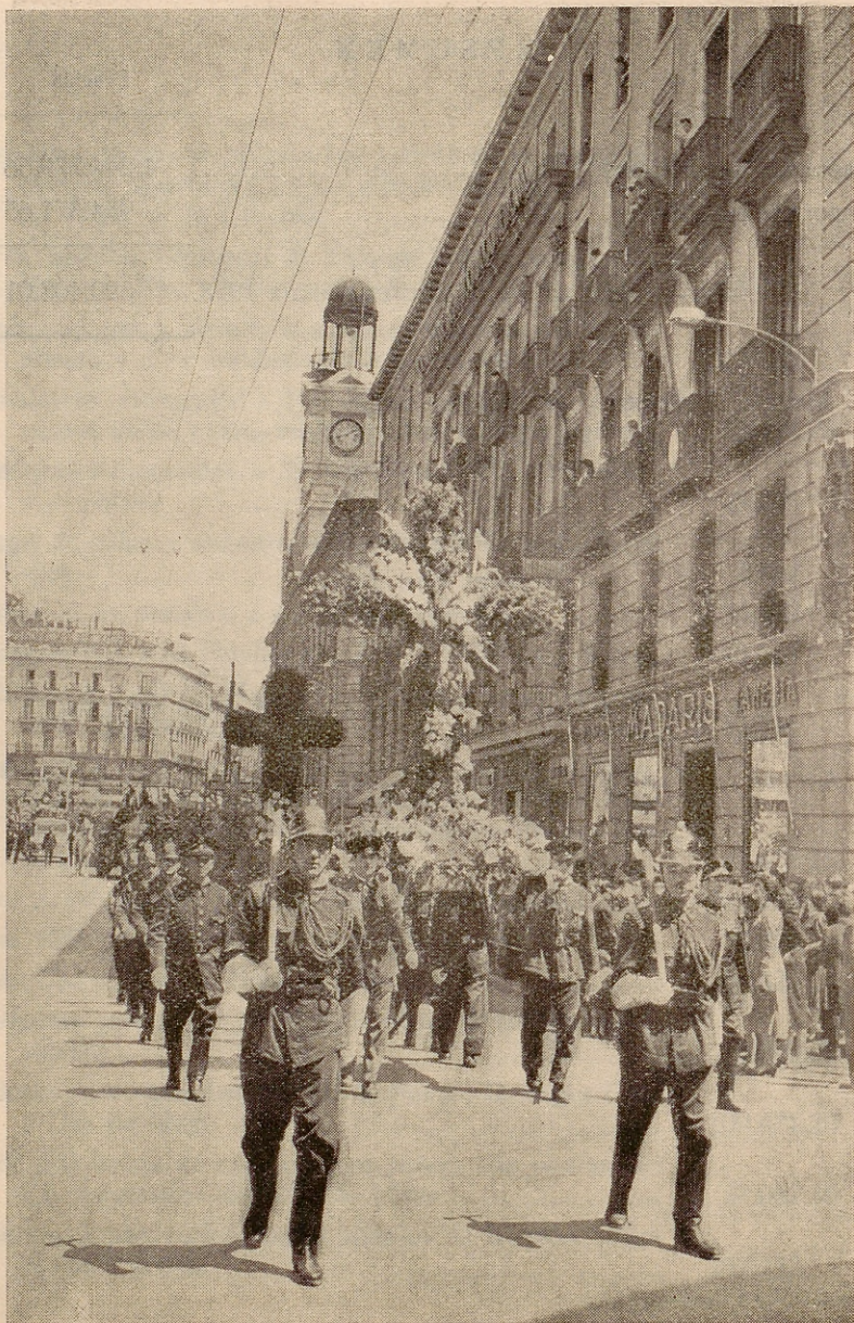
Detalle de la comitiva de la Cruz de Mayo del año 1958 al pasar por la Puerta del Sol