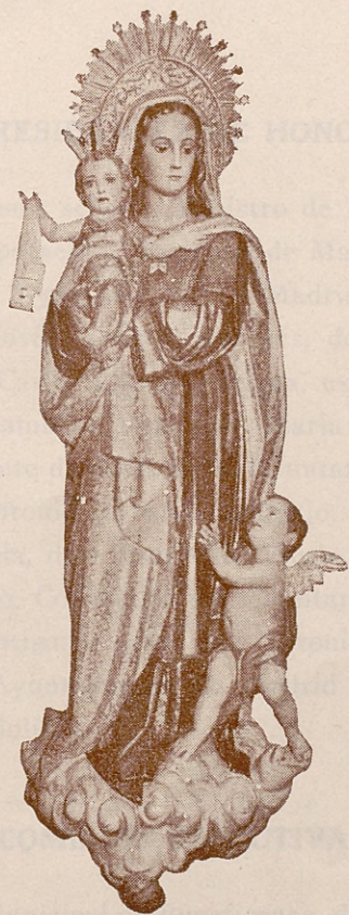
Imagen de Nuestra Señora del Carmen, Patrona de Chamberí, que se venera en la iglesia parroquial de Santa Teresa y Santa Isabel, de Madrid