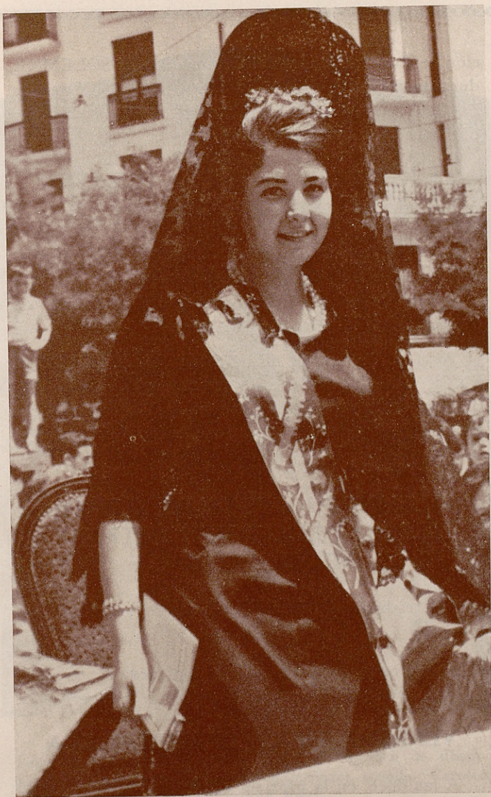
Señorita "Carmen de Chamberí 1962"