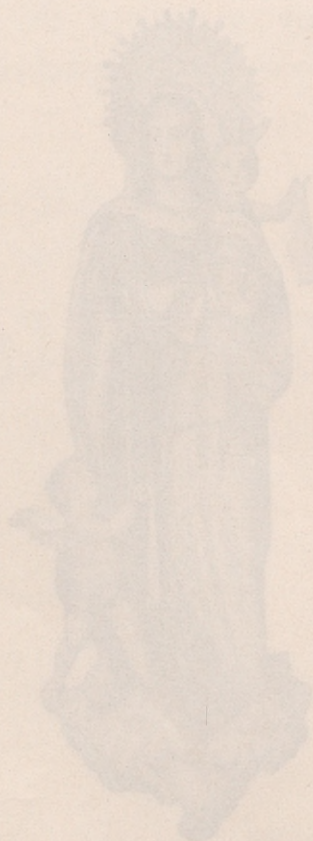
Imagen de Nuestra Señora del Carmen Patrona de Chambray que se venera en la iglesia parroquial de Santa Teresa y Santa Isabel de Madrid