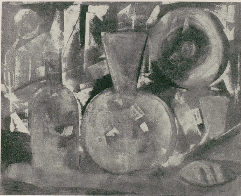
XII Exposición de Arte en Chamberí 1963.—Segundo premio: título, Bodegón ; autor, Joaquín Castro