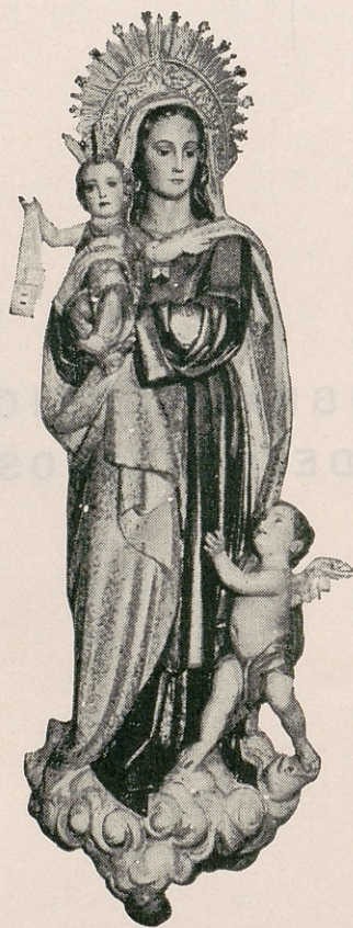
Imagen de Nuestra Señora del Carmen, Patrona de Chamberí, que se venera en la Iglesia parroquial de Santa Teresa y Santa Isabel, de Madrid