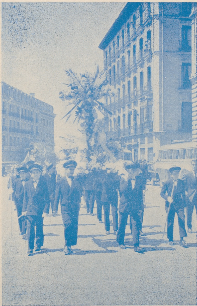
La Cruz de los Internados municipales camino de la plaza de la Villa