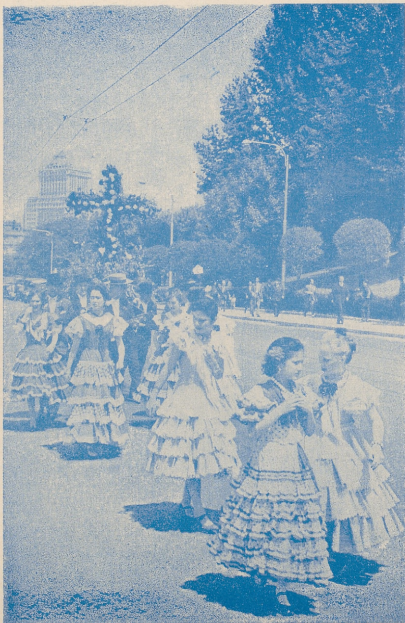
Un detalle de la Cruz de Mayo a su paso por la calle de Bailén