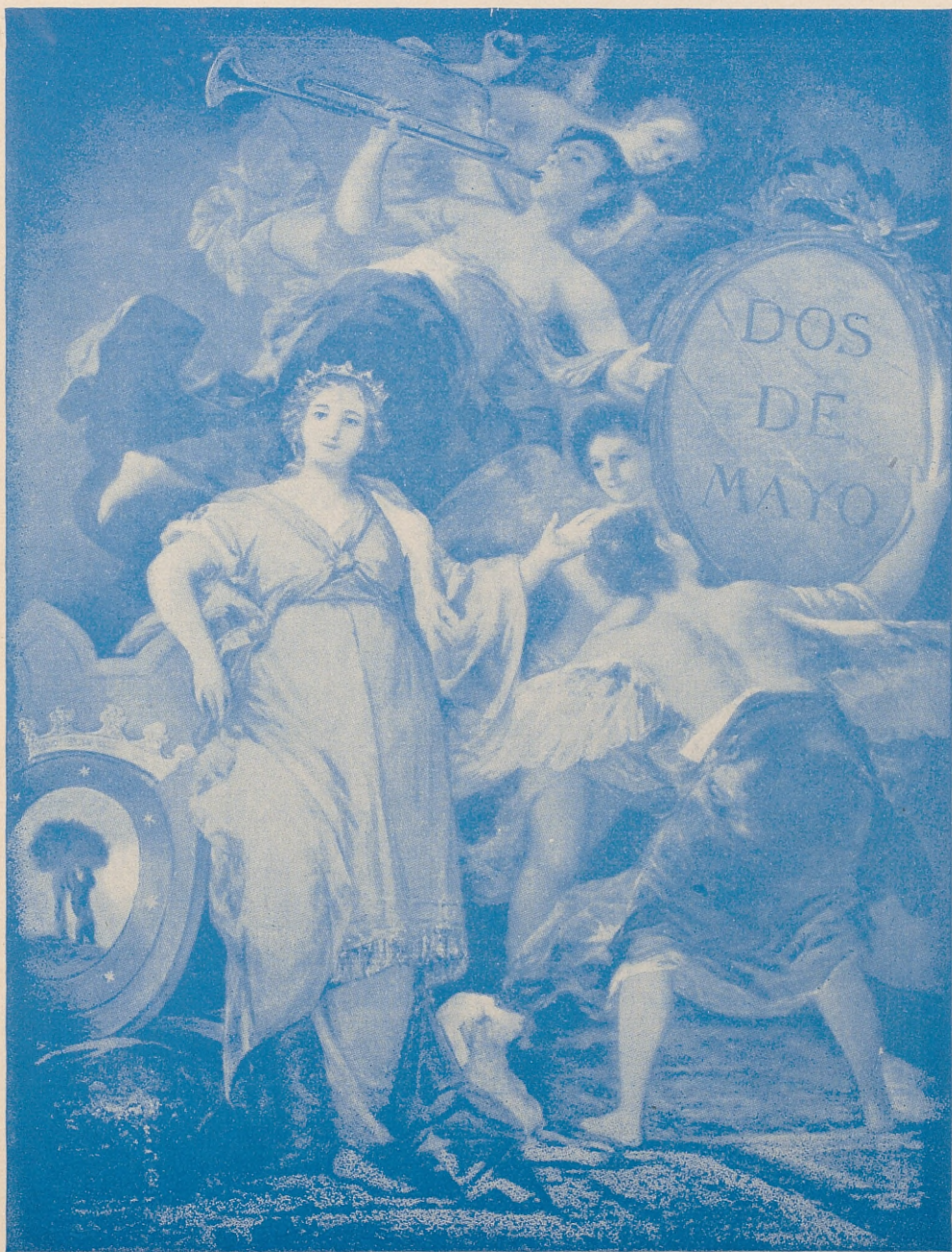
Alegoría de Madrid, que figura en el Salón Goya del Ayuntamiento