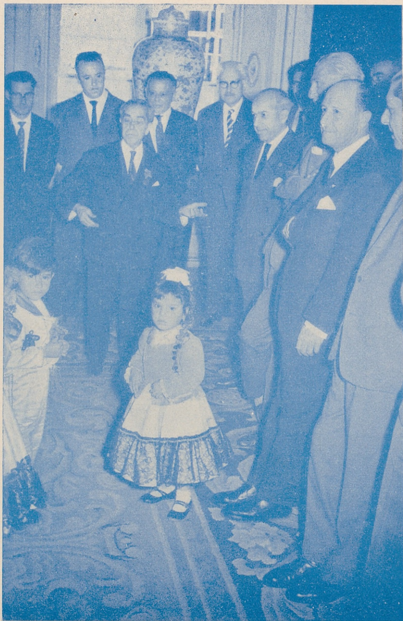
Momento de la ofrenda de la Cruz de Mayo, en el Ayuntamiento