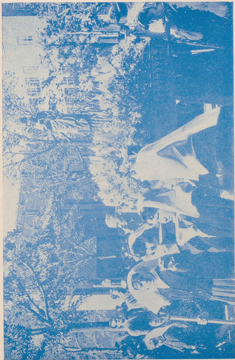
Procesión infantil con la Patrona de Madrid, Nuestra Señora de la Almudena, en las fiestas del Dos de Mayo