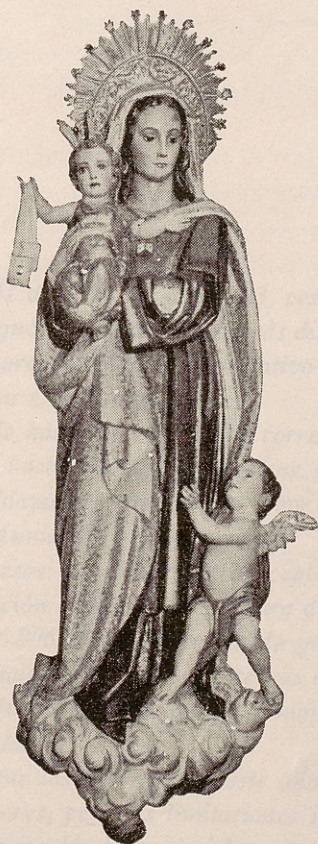
Imagen de Nuestra Señora del Carmen, Patrona de Chamberí, que se venera en la iglesia parroquial de Santa Teresa y Santa Isabel, de Madrid