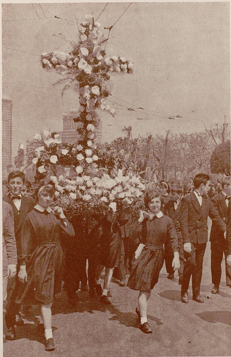
Las niñas y niños de los Internados municipales llevando su Cruz de Mayo 1962 por las principales calles de Madrid