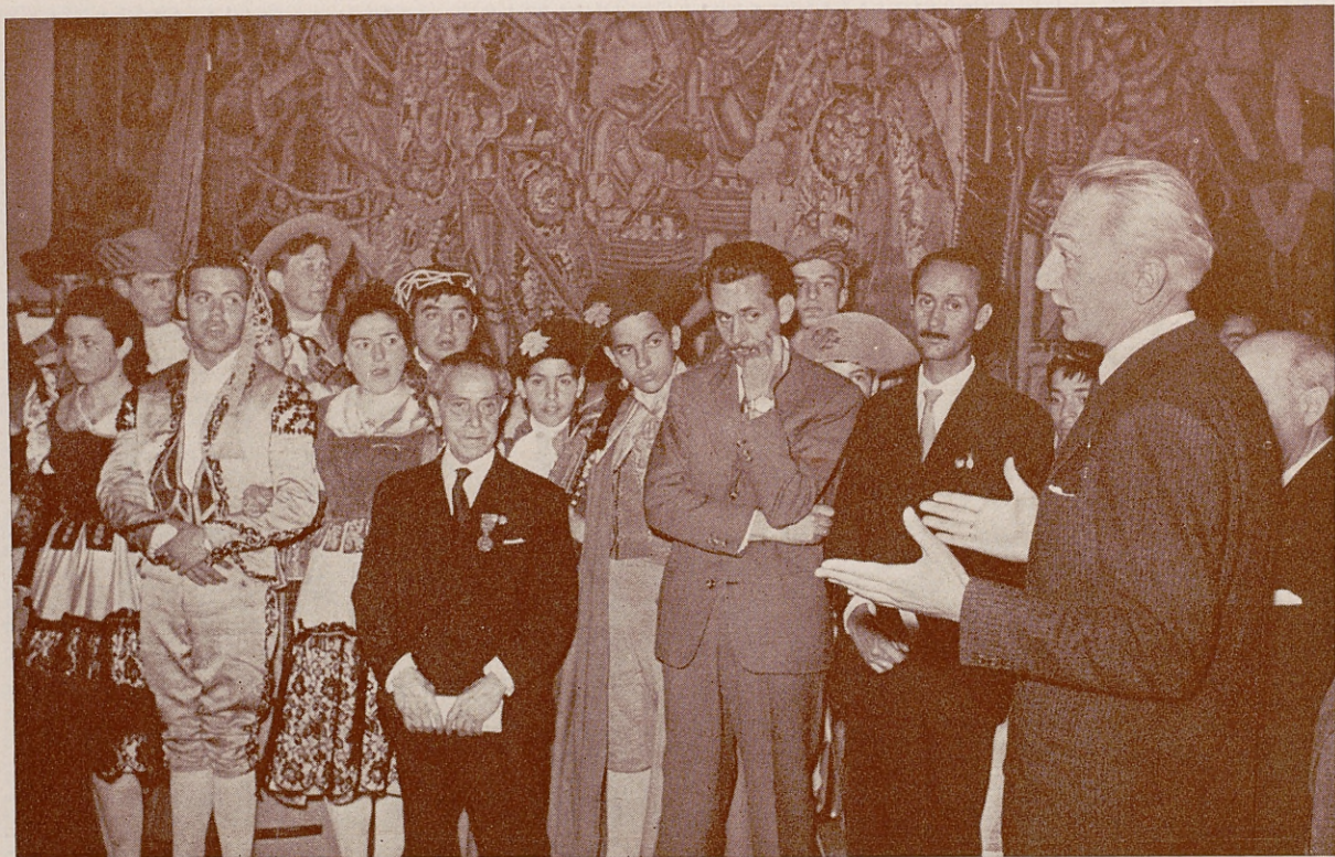
La representación del barrio del Dos de Mayo haciendo entrega de la Cruz en el Ayuntamiento de Madrid