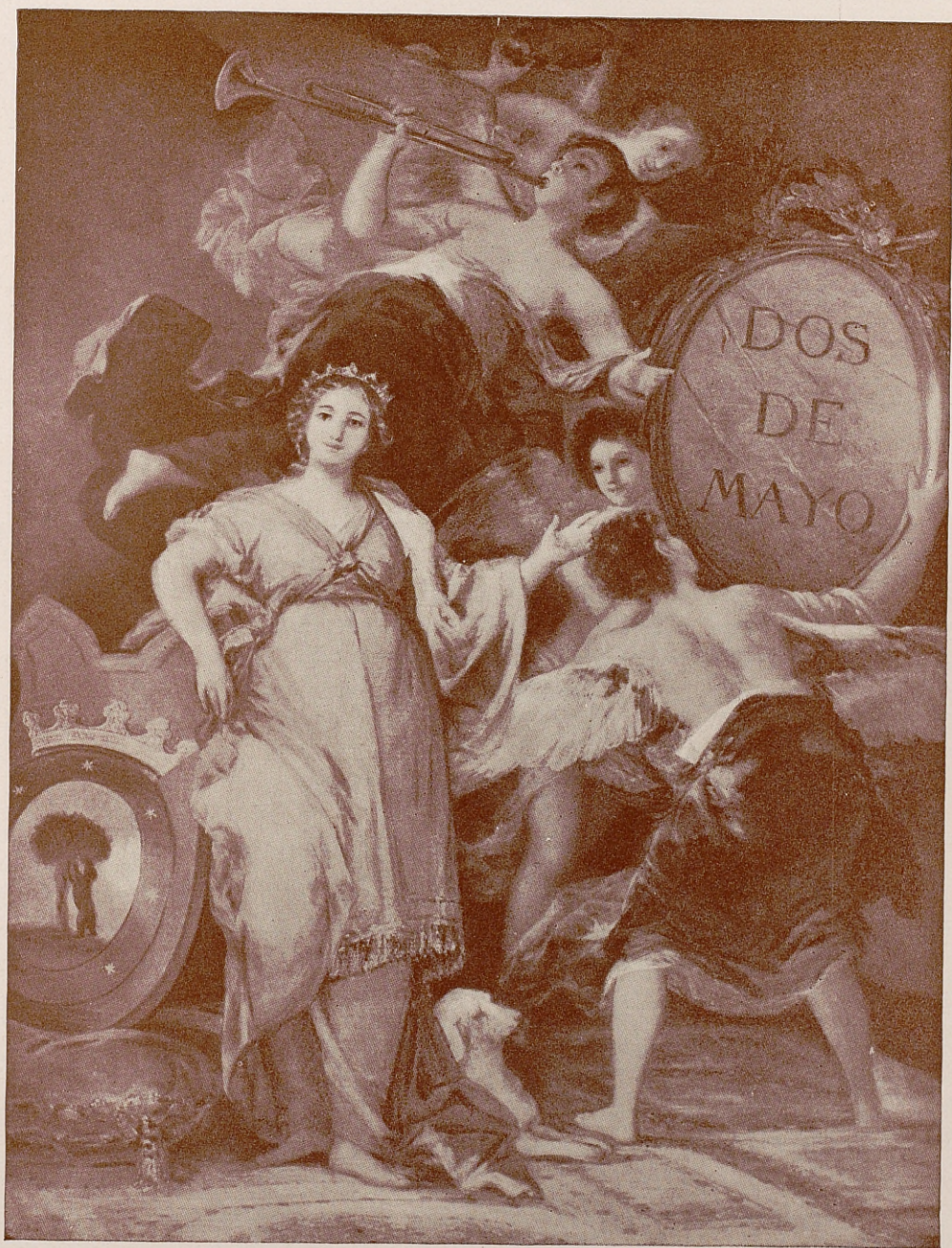
Alegoría de Madrid , que figura en el Salón Goya del Ayuntamiento