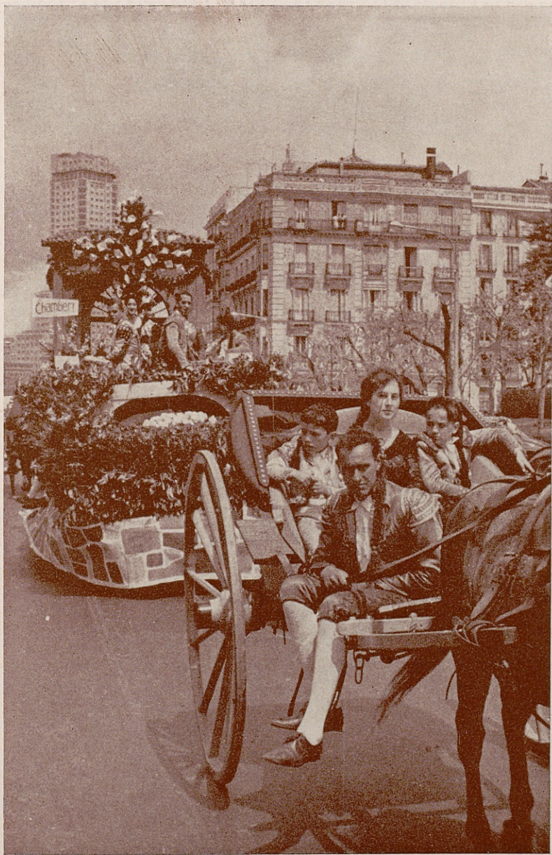
La Cruz de Mayo de Chamberí a su paso por la calle de Bailén