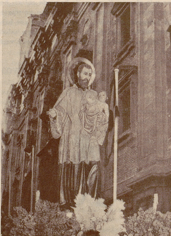
Imagen del Santo Patrón, San Cayetano