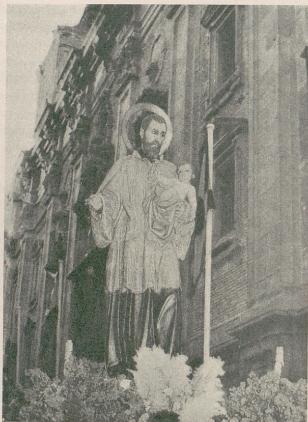
Imagen del Santo Patrón, San Cayetano