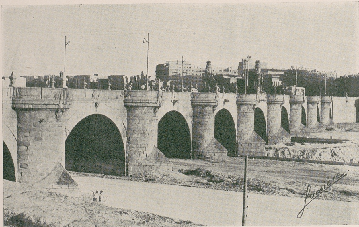
Detalle del Puente de Toledo