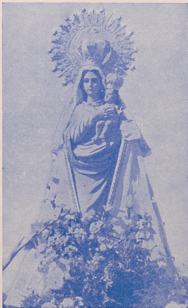
Imagen de la Santísima Virgen del Rosario y de la Torre