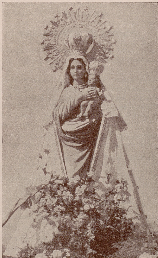
Imagen de la Santísima Virgen de la Torre Patrona de Vallecas