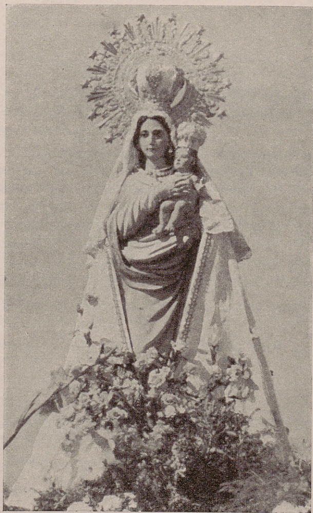
Imagen de la Santísima Virgen de la Torre (Patrona de Vallecas)