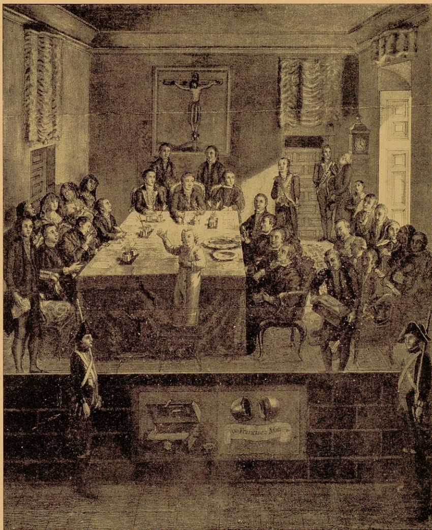
Acto público del sorteo de los cinco números de la R. a LOTERIA DE ESPAÑA.