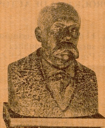
I.N.B. «EMILIO CASTELAR» Río de Oro, 4 y 6