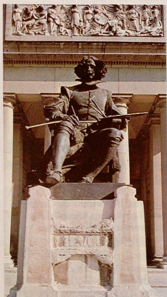
Museo del Prado. Velázquez.