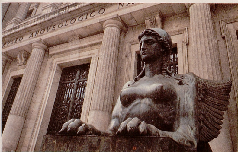
Museo Arqueológico Nacional.