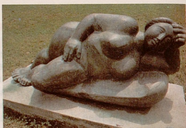
Museo Español de Arte Contemporáneo.