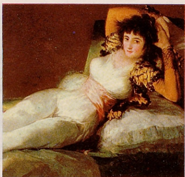
«Maja vestida» de Goya.

Comedor de Gala y el Salón de Gasparini. Ver museos.