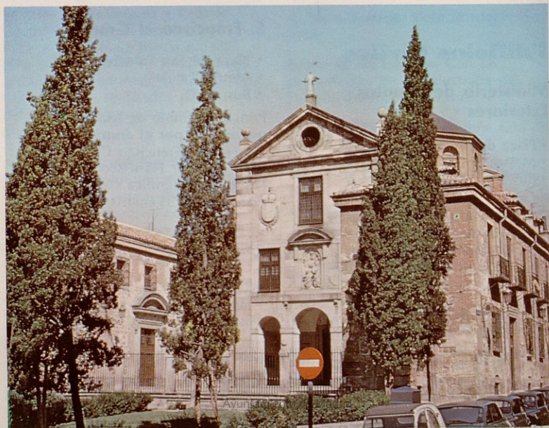
Monasterio de la Encarnación.

Realizada en 1798 por el arquitecto Carlos Fontana por orden de Carlos IV y fue decorada por Goya. En 1881 se