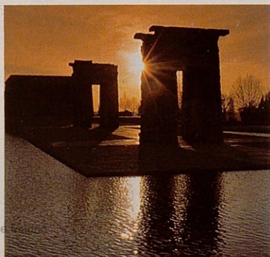
Templo de Debod.