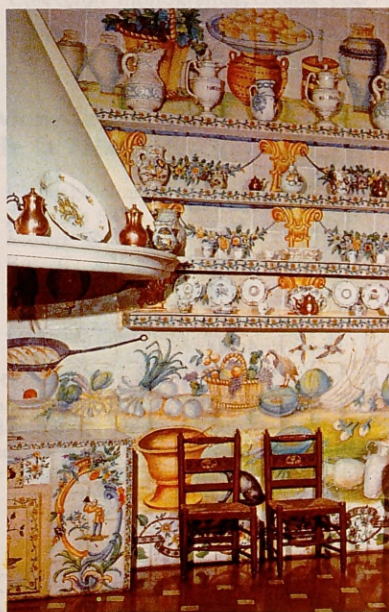
Museo de Artes Decorativas.

Historia de la policía, fotografías, armas y útiles de delito.