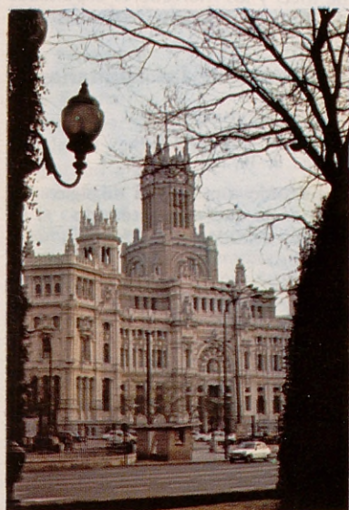
Palacio de Comunicaciones.