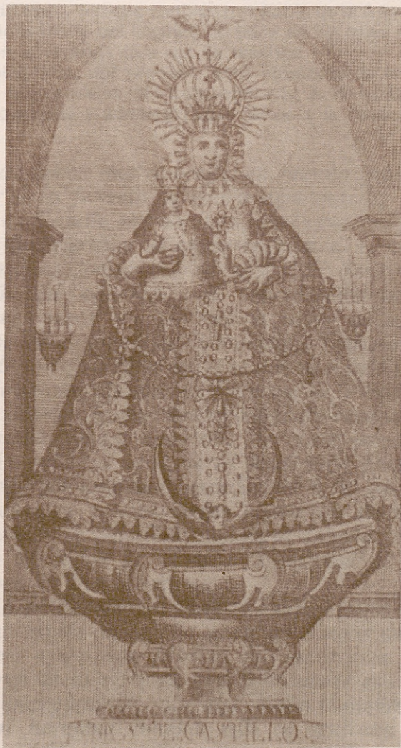
IMAGEN DE NTRA. SRA. DEL CASTILLO

Láminas-postales que los mozos de Perales portaban en sus mochilas, tras su incorporación a filas, en la guerra de Cuba.