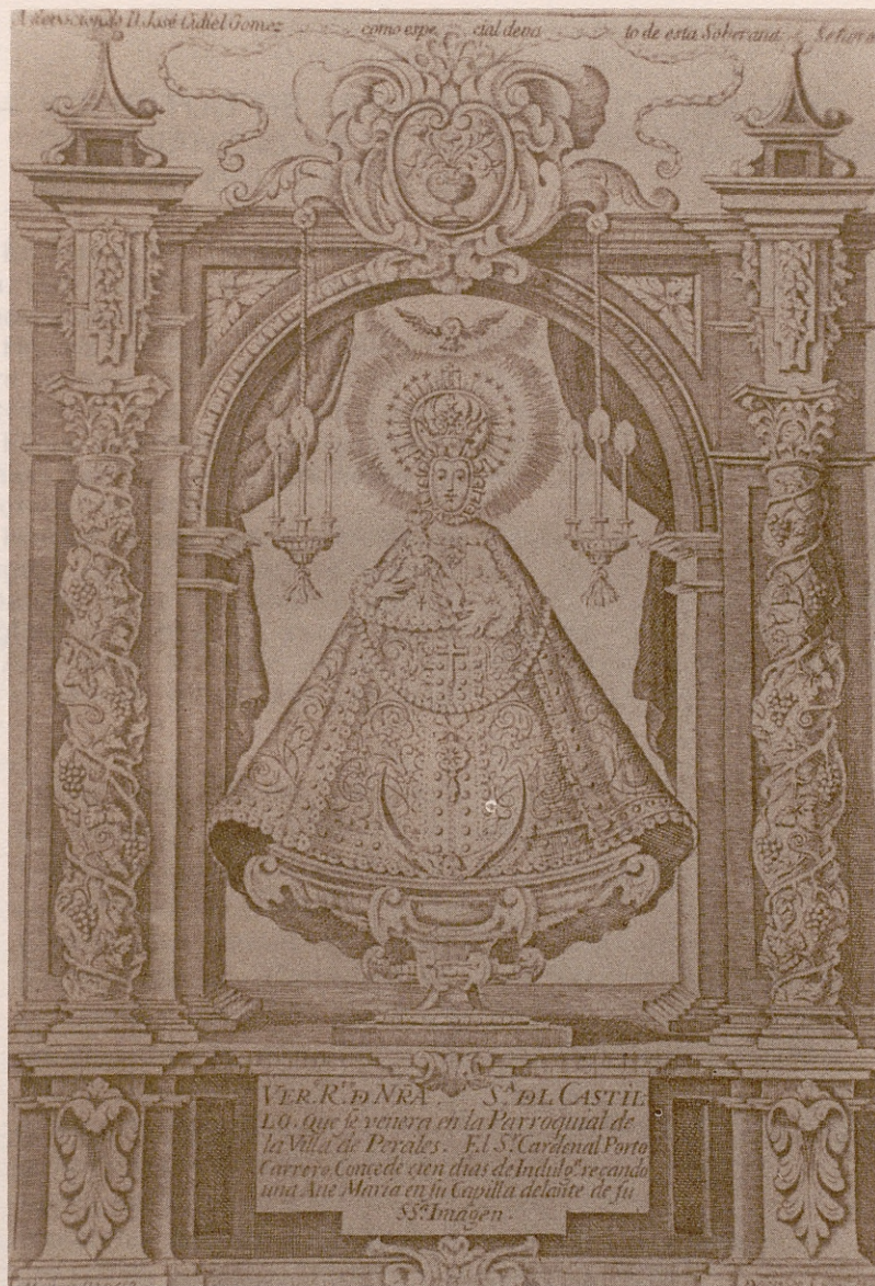
IMAGEN DE NTRA. SRA. DEL CASTILLO EN SU ANTIGUO RETABLO

Lámina que adornaba muchos devocionarios en las viviendas paraleñas. (Lámina-grabado del siglo XVII-XVIII colección particular)