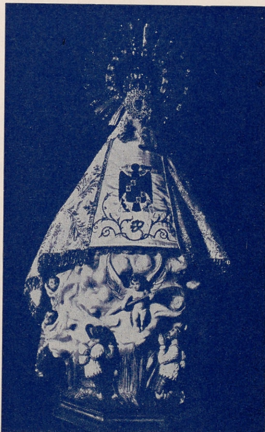
IMAGEN ROMANICA DE LA VIRGEN TAL COMO ESTA BAJO EL MANTO