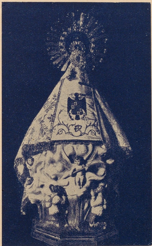
IMAGEN ROMANICA DE LA VIRGEN TAL COMO ESTA BAJO EL MANTO